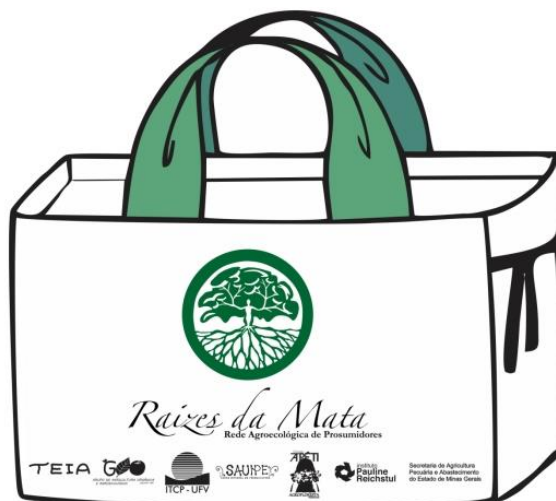
Figura 6. Ecobag [Arte Bolsa], NCE, 2014.

O NCE se propõe também a construir cartilhas de divulgação da economia solidária e temáticas afins. Em parceria com as equipes de incubação, são desenvolvidos os textos e a linguagem a ser adotada. Posteriormente, pensa-se a arte e a elaboração do material, preocupando-se em torná-lo o mais dinâmico possível. Portanto, o NCE adota uma linguagem simplificada com uso de imagens e gravuras que auxiliam no entendimento do conteúdo.