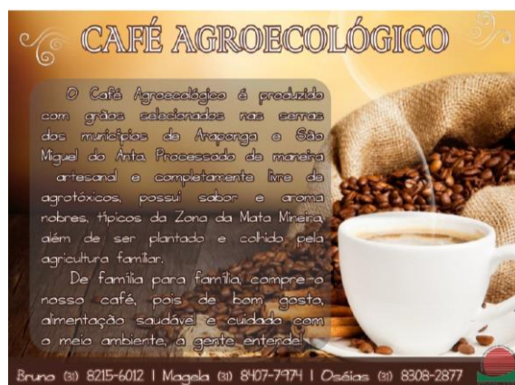
Figura 3. Café Agroecológico [Arte Panfleto], NCE, 2014.

O desenvolvimento de catálogos de produtos para os empreendimentos tem sido uma das demandas frequentes dos grupos incubados. O NCE atenta-se para a história de cada um deles, observando suas especificidades. A partir daí é feito um trabalho de fotografia, visando adquirir imagens tanto dos produtos quanto dos produtores para subsidiar a elaboração desse material. Os catálogos são relevantes para a divulgação das mercadorias dos empreendimentos e para fortalecer a imagem institucional do grupo incubado.