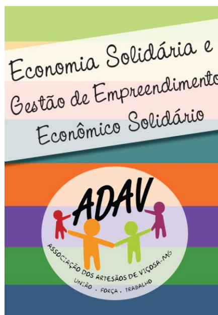
Figura 8. Economia Solidária e Gestão de Empreendimento Econômico Solidário [Arte Cartilha], NCE, 2014.

O Núcleo tem desenvolvido ainda atividades para programas parceiros e para a Universidade Federal de Viçosa. Essas demandas não são de sua responsabilidade, porém o mesmo as entende como um importante fator na aproximação e na afirmação de parcerias. Neste sentido, toda vez que essas demandas surgem, elas são analisadas para