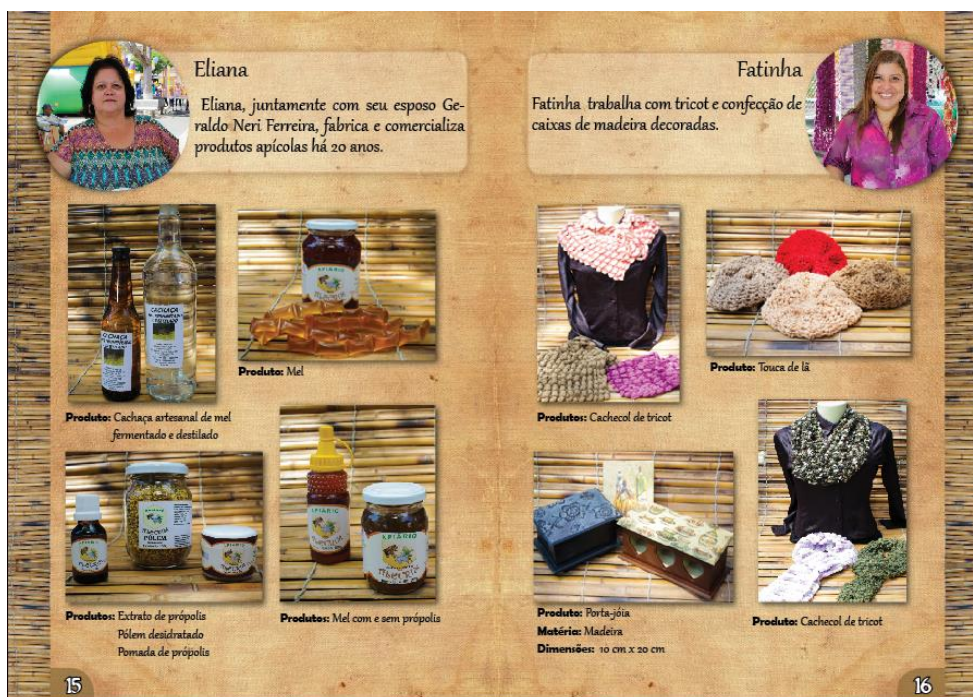
Figura 4. Catálogo ADAV [Arte Catálogo], NCE, 2014.

O desenvolvimento de catálogos de produtos para os empreendimentos tem sido uma das demandas frequentes dos grupos incubados. O NCE atenta-se para a história de cada um deles, observando suas especificidades. A partir daí é feito um trabalho de fotografia, visando adquirir imagens tanto dos produtos quanto dos produtores para subsidiar a elaboração desse material. Os catálogos são relevantes para a divulgação das mercadorias dos empreendimentos e para fortalecer a imagem institucional do grupo incubado.