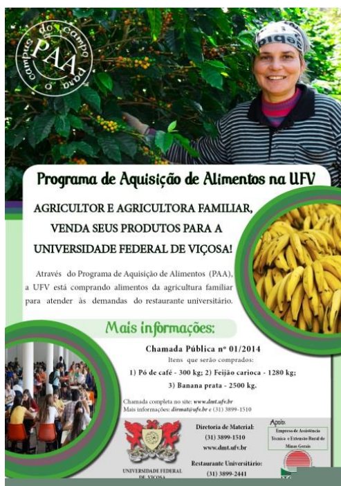
Figura 9. Programa de Aquisição de Alimentos na UFV [Arte Cartaz], NCE, 2014.

saber se a execução dessas demandas é viável e, caso seja, o NCE as desenvolve. Já foram criados materiais de divulgação para programas executados pela Universidade e para eventos.