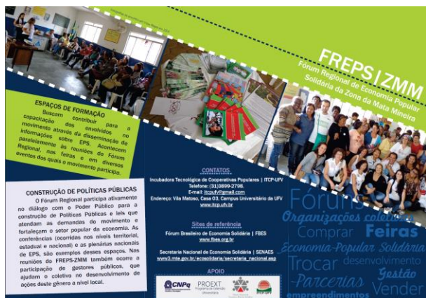
Figura 2. Fórum Regional de Economia Popular Solidária da Zona da Mata Mineira, NCE [Arte Folder], 2014.