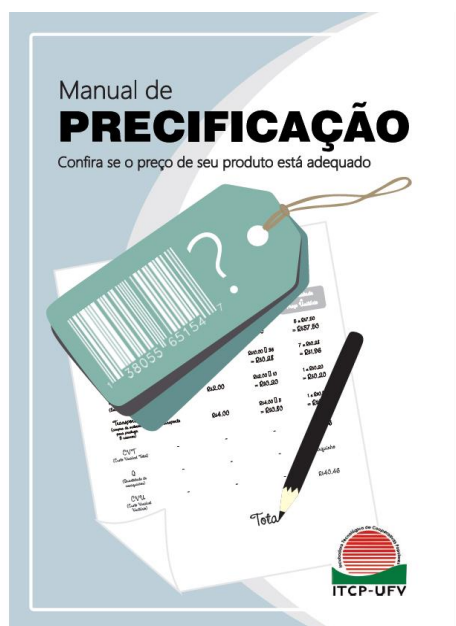
Figura 7. Manual de Precificação [Arte Cartilha], NCE, 2014

O NCE se propõe também a construir cartilhas de divulgação da economia solidária e temáticas afins. Em parceria com as equipes de incubação, são desenvolvidos os textos e a linguagem a ser adotada. Posteriormente, pensa-se a arte e a elaboração do material, preocupando-se em torná-lo o mais dinâmico possível. Portanto, o NCE adota uma linguagem simplificada com uso de imagens e gravuras que auxiliam no entendimento do conteúdo.