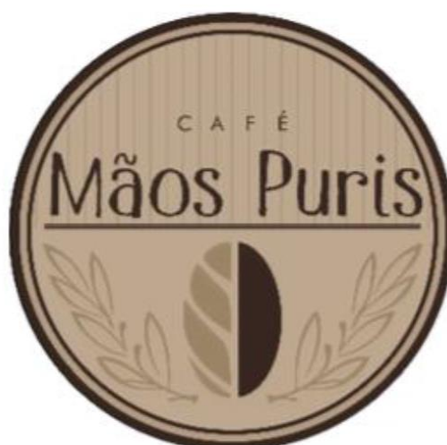
Figura 1. Mãos Puris [Arte Logo], NCE, 2014.

O logo acima, criado pelo NCE para o grupo de cafeicultores de Araponga e São Miguel do Anta, passou por um período de estudos e significados para chegar ao formato final.