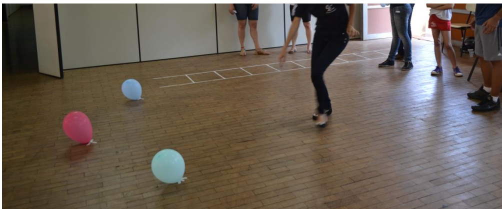
Figura 7. Foto das atividades propostas no estande “movimente-se”.

Segunda atividade: foram posicionadas três bexigas de cores diferentes fixas ao chão, onde o participante ficava a uma distância de cerca de cinco metros em frente à bexiga do meio. Foi dado um comando ao visitante para que quando fosse tocado no meio de suas costas, ele deveria correr em direção à bexiga do meio; quando fosse tocado do lado direito de suas costas, deveria correr e tocar a bexiga direita e se fosse tocado à esquerda, deveria correr e tocar a bexiga esquerda. Após estar familiarizado com a atividade, o monitor tocava uma parte de suas costas e falava a cor de uma das bexigas, que poderia ser congruente com o toque, por exemplo: “vermelho” e tocava no meio das costas do participante (sendo que a bexiga vermelha estava no meio da pista), ou incongruente, dizer “vermelho” e tocar no lado esquerdo das costas do participante (sendo que do lado esquerdo a bexiga era “verde”). O visitante deveria correr e tocar a bexiga de acordo com o toque do monitor e não pelo comando de voz. Dessa forma, é possível treinar a atenção e a concentração.