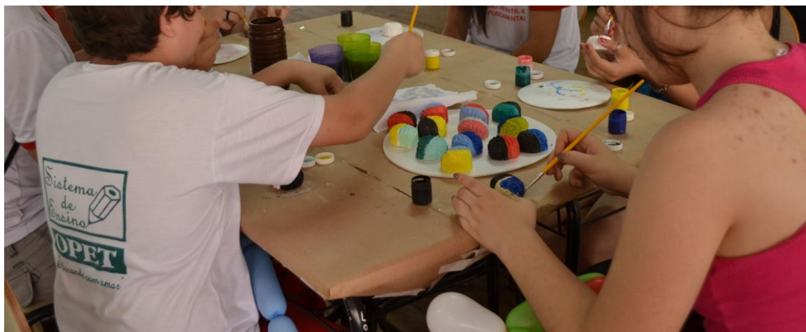
Figura 9. Imagem dos participantes pintando o cérebro de gesso.

Na atividade “pinte o cérebro de gesso”, cada visitante recebia um cérebro de gesso e o pintava com tinta guache. Os visitantes podiam pintar um hemisfério de cada cor, ou um lobo de cada cor, conforme explicações prévias da atividade “pinte o cérebro no papel” e as explicações dos monitores na exposição de neuroanatomia (Figura 9).