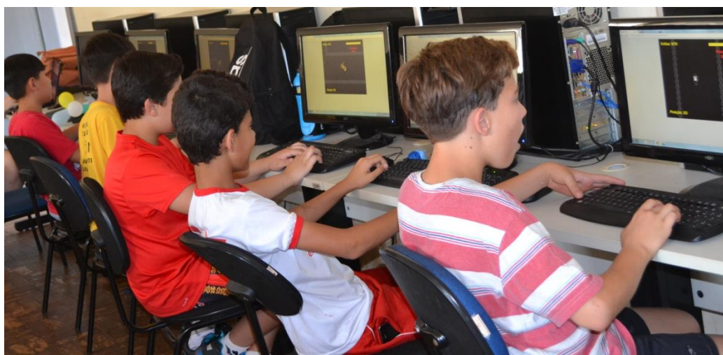
Figura 6. Foto dos visitantes jogando o jogo desenvolvido na UENP.

O presente estande foi realizado no Laboratório de Informática 4 da UENP/CLM, com pelo menos dois monitores em cada período que apresentaram dados científicos sobre os videogames e cognição, objetivando informar os visitantes sobre o efeito dos jogos para a cognição ( OEI; PATTERSON, 2013 ; RIVERO; QUERLINO; STARLING-ALVES, 2012 ). Por exemplo, na revisão realizada por Rivero, Querlino e Starling-Alves (2012) , os autores apontam melhora em diversas funções cognitivas, como na atenção. Oei e Patterson (2013) mostraram que jogar uma hora por dia pode melhorar tarefas cognitivas: jogos de ação melhoram na busca por objetos e jogos de quebra-cabeça auxiliam na identificação visual de diferentes tipos de objetos em menos tempo, ambos benefícios relacionados à memória seletiva. Após a apresentação dos dados, os participantes puderam jogar um jogo, desenvolvido por meio de uma parceria entre UENP e Universidade Federal de São Paulo (UNIFESP), que consiste em um jogo de corrida idealizado a partir de métricas de reforço diferencial de baixa taxa de resposta (DRL) (Figura 6).