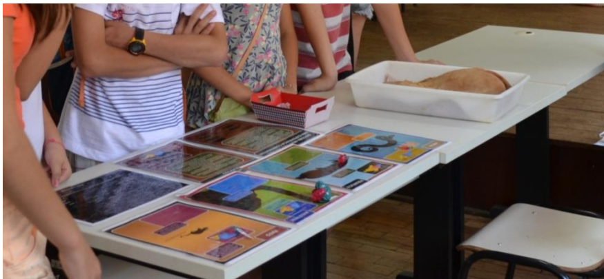
Figura 5. Exposição do material do Labcog-USP e peças do Laboratório de Anatomia da UENP.

Os materiais utilizados foram: um banner com imagens do sistema nervoso, peças neuroatômicas pertencentes ao Laboratório de Anatomia Humana da UENP/CLM e peças de cérebros feitas de acrílico, a partir de molde de tamanho real de alguns animais, entre eles: ratão do banhado, rato, avestruz, pirarucu, jibóia e tubarão martelo. A diversidade anatômica do sistema nervoso entre as diferentes espécies é grande ( BEAR; CONNORS; PARADISO, 2008 ) e com a exposição desses materiais, tal diversidade foi bem notória.