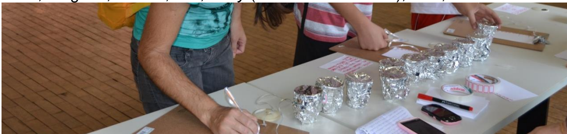
Figura 3. Disposição do experimento do olfato.

O primeiro experimento, o olfatório, consistiu em fazer o participante sentir o cheiro de substâncias dentro de diversos copos plásticos descartáveis (150 ml), cobertos com papel alumínio perfurado, de forma que não permitisse a visualização do seu interior. Assim, os visitantes deveriam sentir o cheiro do que estava dentro do copo e escrever em uma prancheta com uma folha de papel enumerada de 1 a 11 (Figura 3), qual substância acreditavam ser. As substâncias utilizadas no experimento foram: cacau, canela, erva-doce, cravo, orégano, hortelã, mel, curry (condimento indiano), alho, alecrim e café.