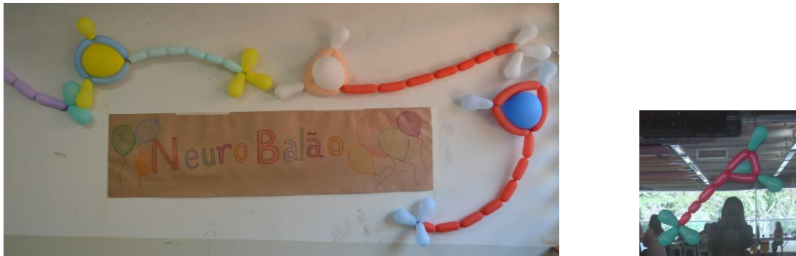
Figura 10. Foto dos neurobalões expostos na parede e do mini-neurobalão montado.

A atividade do neurobalão (inspirada em Neurobalão do Museu Itinerante de Neurociências ) foi complementar a essas atividades e teve como objetivo reforçar o conhecimento do que é um neurônio e qual a sua função. Para fazer um mini neurobalão, que os visitantes poderiam levar embora, foram necessários: seis bexigas pequenas (tamanho zero), sendo três para representar o terminal sináptico, dois para representar os dendritos, um para representar o corpo celular e uma bexiga comprida para representar o axônio. Para encher as bexigas foi utilizada uma bombinha; bexigas estouradas foram cortadas com tesoura para representarem os nódulos de Ranvier (Figura 10).