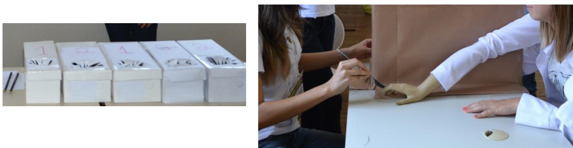
Figura 4. Caixas surpresas e experimento de assimilação do braço (Fotografia por Luís Ricardo Prieto).

O segundo experimento, “o braço de assimilação”, utilizou os seguintes materiais: duas penas, um braço de manequim, dois jalecos e papelão. O participante sentava na cadeira, escondia seu braço atrás de uma “parede” de papelão e colocava o jaleco junto ao braço de manequim a sua frente, paralelo ao braço real escondido atrás do papelão. Em seguida, o expositor passava uma pena no braço do participante e outra no manequim, com a finalidade de assimilar a sensação sentida no braço real, ao braço do manequim. Após o período inicial, o expositor interrompia o contato da pena no braço do participante e mantinha o processo somente no braço de manequim, que era o braço que o participante observava. Dessa forma, muitos participantes podiam assimilar o braço do manequim com o seu próprio braço (Figura 4).