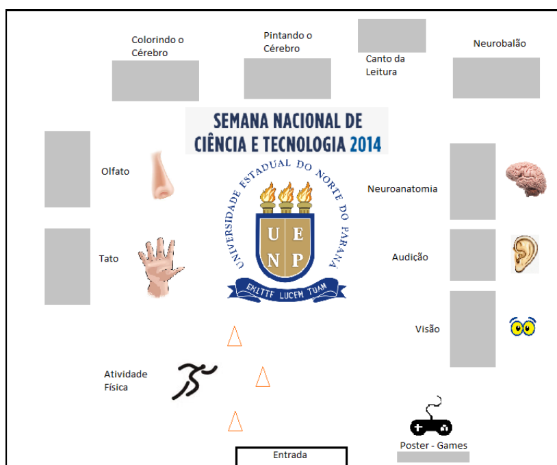
Figura 1. Esquema representativo da disposição dos estandes no local do evento.

cognição, exposição de neuroanatomia, atividades lúdicas (pinte o cérebro, neurobalões) e cantinho da leitura com o livro “As dúvidas de Stem, uma pequena célula multipotente”, de autoria de Silva, Brockington e Queiroz (2003) .