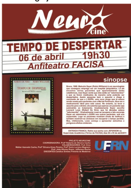
Figura 1. Cartaz de divulgação do filme a ser exibido pelo projeto.

As sessões eram limitadas ao número de lugares disponíveis no anfiteatro (50 lugares) a fim de permitir conforto e acomodação necessária a todos os participantes para