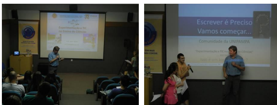
Figura 7. Palestra sobre experimentação e TICs no ensino de ciências.

Nesta etapa também ocorreu uma palestra com professor convidado envolvendo a temática principal do programa: “Experimentação e TICs no ensino de ciências”, um momento que proporcionou ao público a oportunidade de discutir o assunto e, desta forma, enriquecer os saberes de todos (Figura 7).