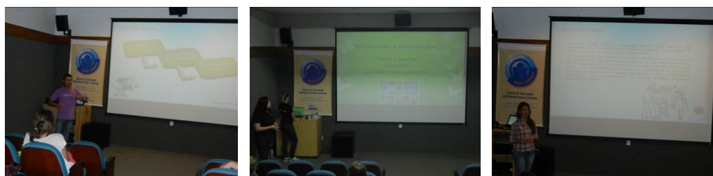
Figura 5. Acadêmicos bolsistas do programa apresentando os resultados do programa e suas percepções sobre a experiência.

Etapa 4 (20h): Ao final do programa foi realizado um seminário de compartilhamento de experiências, no qual os alunos de graduação componentes da equipe executora e os professores participantes, apresentaram resultados de sua participação no programa. Os alunos, graduandos dos cursos de Enfermagem, Fisioterapia, Licenciatura em Educação Física e Licenciatura em Ciências da Natureza, discorreram sobre a sua percepção ao longo do trabalho e a experiência de participar na capacitação, e apresentaram os resultados observados (Figura 5).