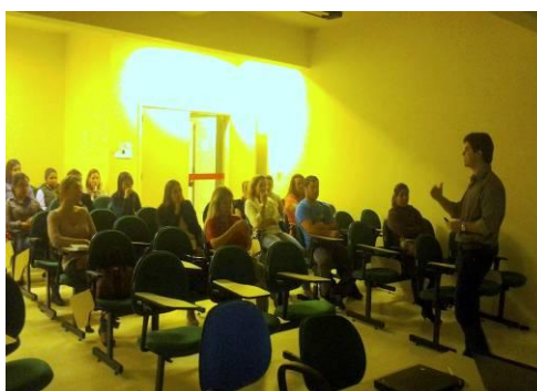
Figura 3. Atividade presencial com os professores no auditório da Unipampa, campus Uruguaiana, para discussão da inserção da fisiologia na escola.

Nesta etapa também foi discutida a inserção das ciências e da fisiologia no currículo escolar (Figura 3) e a importância do trabalho contextualizado à realidade do aluno, considerando a influência de fatores externos, como, por exemplo, a mídia, sobre a construção de conhecimento do aluno (Figura 4).