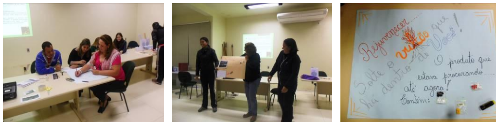
Figura 4. Atividade presencial com os professores no auditório da Unipampa, campus Uruguaiana, para discutir a importância do ensino contextualizado.

Etapa 4 (20h): Ao final do programa foi realizado um seminário de compartilhamento de experiências, no qual os alunos de graduação componentes da equipe executora e os professores participantes, apresentaram resultados de sua participação no programa. Os alunos, graduandos dos cursos de Enfermagem, Fisioterapia, Licenciatura em Educação Física e Licenciatura em Ciências da Natureza, discorreram sobre a sua percepção ao longo do trabalho e a experiência de participar na capacitação, e apresentaram os resultados observados (Figura 5).