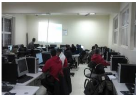
Figura 1. Atividade presencial com os professores no Laboratório de Informática da Unipampa, campus Uruguaiana.

Para complementar o trabalho com as TICs, ocorreram também atividades à distância, nas quais os professores utilizavam o Moodle, envolvendo a criação de fóruns e realização de atividades variadas na própria plataforma. O programa de capacitação para uso de TICs na escola foi desenvolvido de acordo com o seguinte programa: