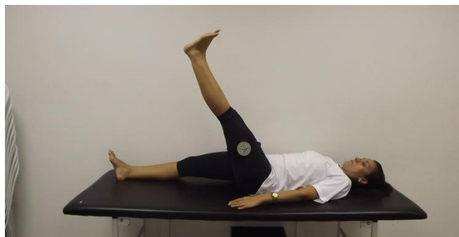
Figura 1. Atleta avaliando flexibilidade dos flexores com joelho com flexímetro