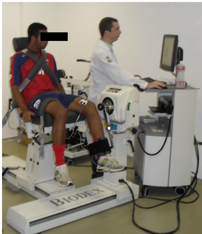
Figura 4. Atleta profissional realizando o teste no dinamômetro isocinético, associado ao eletromiógrafo de superfície.