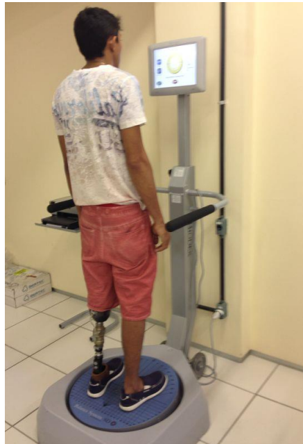
Figura 4. Para-atleta realizando o avaliação de equilíbrio no equipamento Balance System

Na terceira estação, foram realizados os testes de força muscular e de eficiência neuromuscular. Utilizando um equipamento no dinamômetro isocinético da marca Biodex ® ( System 4 Pro ), responsável por avaliar o pico de torque, índice de fadiga e as diferenças e relações de força nos seguimentos avaliados (Figura 4). Para tal procedimento, os atletas realizavam aquecimento durante 5 minutos. Em seguida os sujeitos sentavam na cadeira do dinamômetro e o seu posicionamento é estabilizado com cintos colocados ao nível do tronco, abdômen. O protocolo de análise variava de acordo com os grupamentos musculares e articulações a serem observadas, no entanto, o teste sempre se inicia pelo membro dominante e o protocolo estabelecido era de contrações concêntricas para agonista e antagonistas com no mínimo duas velocidades que variavam entre 60° e 360°/s, com intervalo de 30 segundos entre as series. Aliado ao dinamômetro isocinético foi utilizado um eletromiógrafo de superfície Miotool 400 , da marca Miotec, composto por um sistema de 4 canais, com frequência de amostragem de 2000Hz por canal. O sinal analógico é convertido em digital pelo sensor SDS500. Os eletrodos utilizados são eletrodos para adultos da marca Meditrace . O eletromiógrafo de superfície é responsável por registrar a soma da atividade mioelétrica das fibras musculares ativas e a eficiência neuromuscular quando é associado ao dinamômetro isocinético.