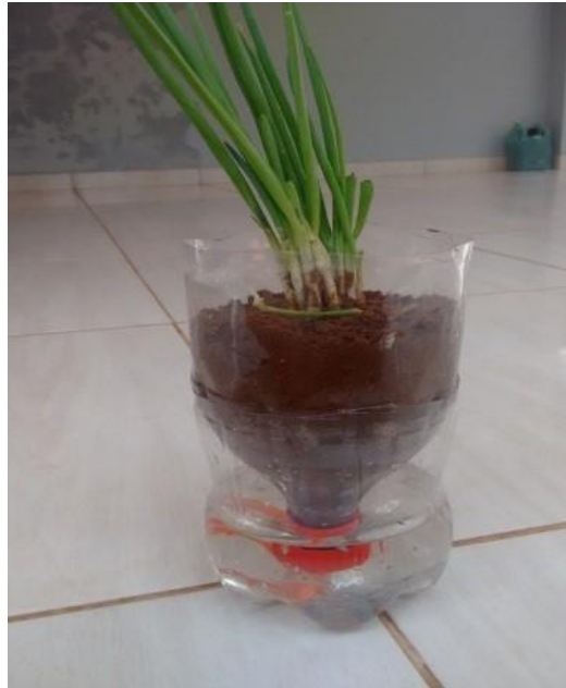
Figura 4. Vaso irrigável de garrafa PET (SUB1).