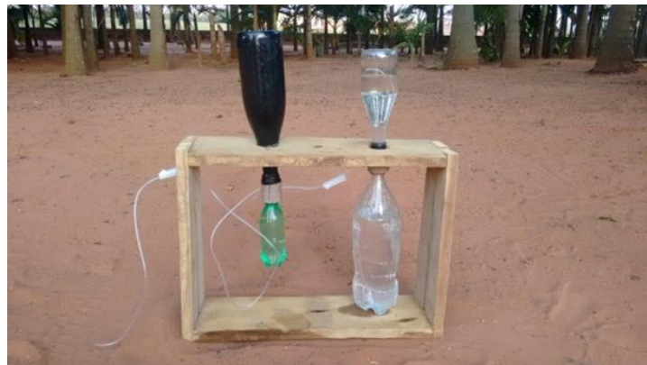
Figura 5. Irrigador solar (SOL1).