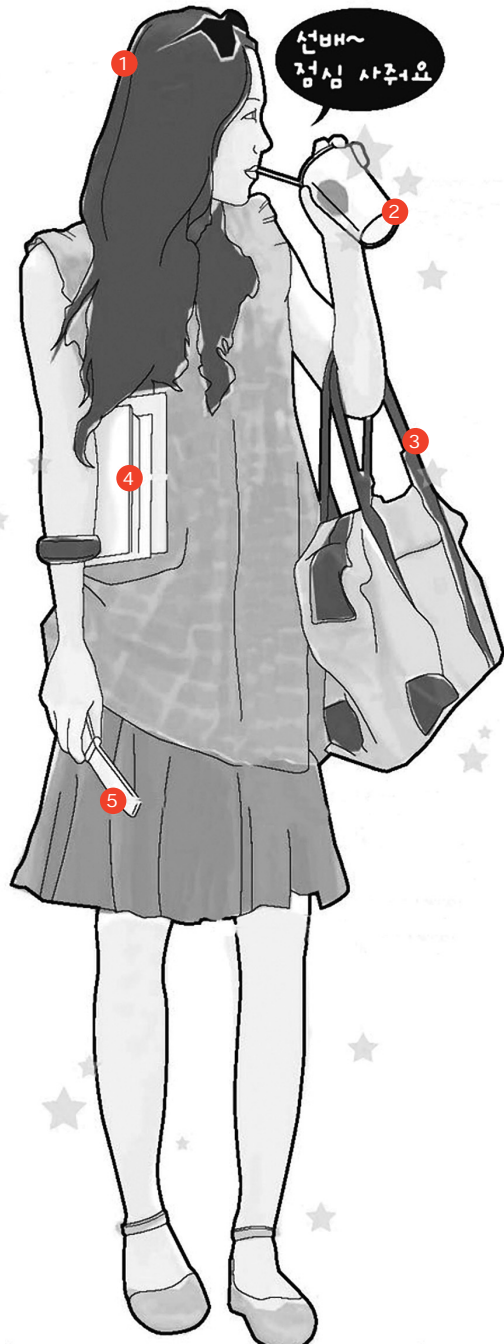
된장녀, 조선일보 2006년 8월 5일

그러나 물질적 안정의 시대에 성장한 세대는 그렇지 않은 세대와는 소비의 합리성을 구성하는 기준이 매우 다르다. 불과 반세기 전에 한국 사회는 가난과 배고픔에 시달렸지만 오늘날 많은 사람들은 비만과 성인병 등으로 시달리고 있다. 5천원짜리 설렁탕 보다는 2천원 정도로 김밥을 먹거나 혹은 아