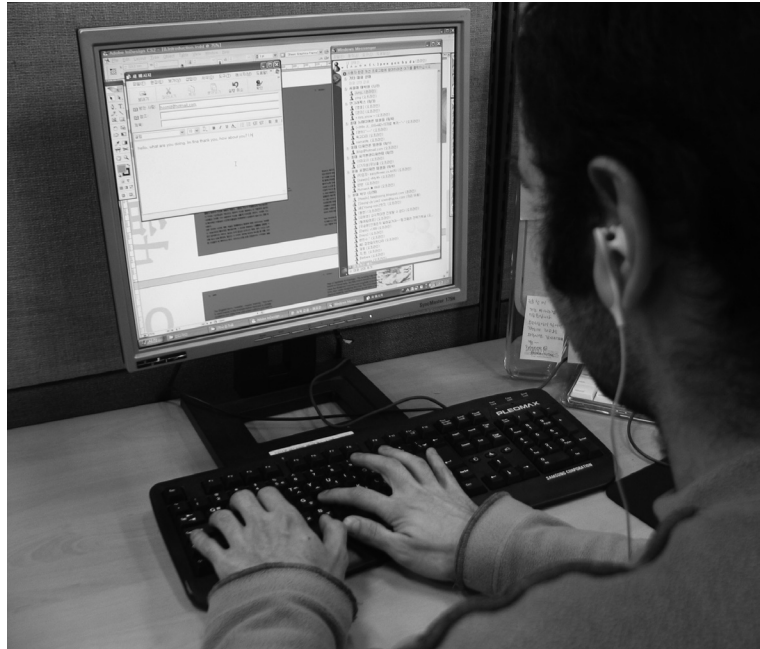
10개도 넘는 창을 동시에 열어 놓고 일하는 학생 A student who is working with over 10 windows at the same time

기계동력을 이용한 이동성의 획기적 증대를 시대의 법칙이자 유행이라고 생각한 것이다. 움직이고 움직이는 산업사회의 인간 군상을 시인은 이렇게 보았다. 물리적 이동 속도의 획기적 변화는 과연 신기한 현상이었음에 틀림이 없었을 것이다. 그러나 여전히 이동은 기존의 관계와의 단절을 각오해야 하는 것이었다. 뮤지컬 영화 <지붕 위의 바이올린>을 보면 이동이 동반하는 영원한 이별과 단절의 아픔을 실감나게 표현하는 장면이 있다. 애인을 따라 시베리아로 떠나는 딸을 전송하기 위해 별관에 있는 마을의 간이역에 나란히 앉아서 기차를 기다리고 있는 부녀는 기약 없는 이별, 거의 마지막이 될 것을 서로 예감하면서도 편지를 보내라고 말하는 이별