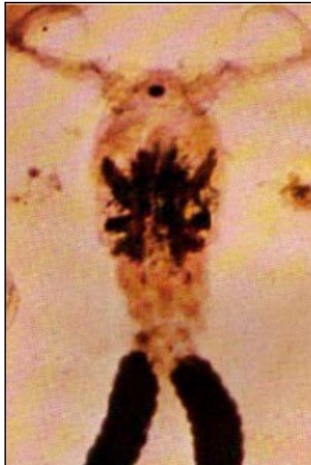
Gambar 5. Foto hasil pengamatan Ergasilus sp (perbesaran 10x10)

luka. Menurut Kabata (1985) dalam buku Metode Standar Pemeriksaan HPIK (2007), ikan yang terinfeksi Ergasilus sp akan mengalami kesulitan dalam menyerap zat asam dan dapat menimbulkan anemia hal ini dan dapat menyebabkan terhambatnya pertumbuhan ikan.