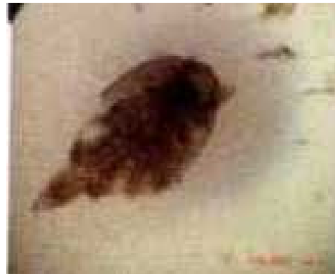
Gambar 7. Foto hasil pengamatan Argulus sp (Perbesaran 10x10)

Pada pengamatan ektoparasit ditemukan jenis Argulus sp (Gambar 10). parasit ini hidup pada permukaan kulit ikan, bentuk tubuhnya pipih dorsoventral, pipih, cembung bagian dorsal dan cembung pada bagian ventralnya, dengan fasilitas pelekat pada inang.