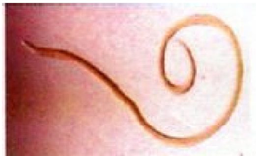
Gambar 4 . Foto hasil pengamatan Anasakis sp (perbesaran 10x10)

Menurut Lorenzo (2000), Anasakis sp. mempunyai siklus hidup yang kompleks. Telur Anasakis sp. menetas di air laut dan larvanya dimakan crustacea. Crustacea yang terjangkit larva tersebut apabila dimakan ikan, maka Anasakis bertahan di usus ikan, makan, berkembang, dan mengeluarkan telur di air laut melalui feses inang.