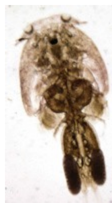
Gambar 2. Foto hasil pengamatan Caligus sp (perbesaran 10x10)

Parasit Caligus sp.) yang ditemukan di tambak dan KJA pengambilan sampel memiliki ciri-ciri, cephalothoraks pipih dorsoventral, permukaan ventralnya cekung, dan permukaan dorsalnya cembung. Fungsi seperti penghisap untuk menempel pada tubuh ikan sehingga mencegah parasit terlepas dari inang karena arus air.