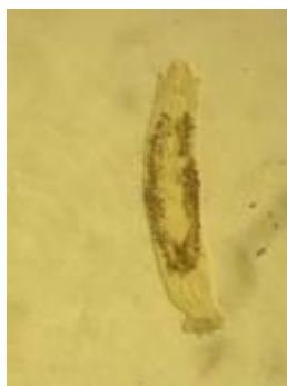
Gambar 3. Foto hasil pengamatan Diplectanum sp. (perbesaran 10x10)

Pada pengamatan endoparasit pada usus sampel ikan Kerapu Macan dari tambak dan KJA ditemukan parasit dengan ciri-ciri berukuran kecil (antara 1 – 1,5 mm). Bentuk simetris bilateral, pipih dorsoventral (Gambar 6). Menurut Grabda (1991), selain ciri yang telah disebutkan juga terdapat opisthaptor, yaitu organ yang berfungsi untuk menempelkan diri terletak pada posterior dari tubuh. Ujung anterior ada semacam alat penghisap yang berfungsi sebagai mulut. Bagian ini juga untuk mengikatkan ujung anterior dari tubuh pada permukaan inang selama makan juga sebagai pegangan tambahan selama pergerakan. Pada ujung anterior terdapat dua lubang atau lebih, terdapat organ genital dan saluran ekskresi pada tubuh yang ditutupi oleh kutikula, mempunyai squamodisc (suatu struktur yang berbentuk oval yang muncul di atas permukaan opisthaptor dan dilengkapi dengan otot yang berfungsi sebagai sucker).