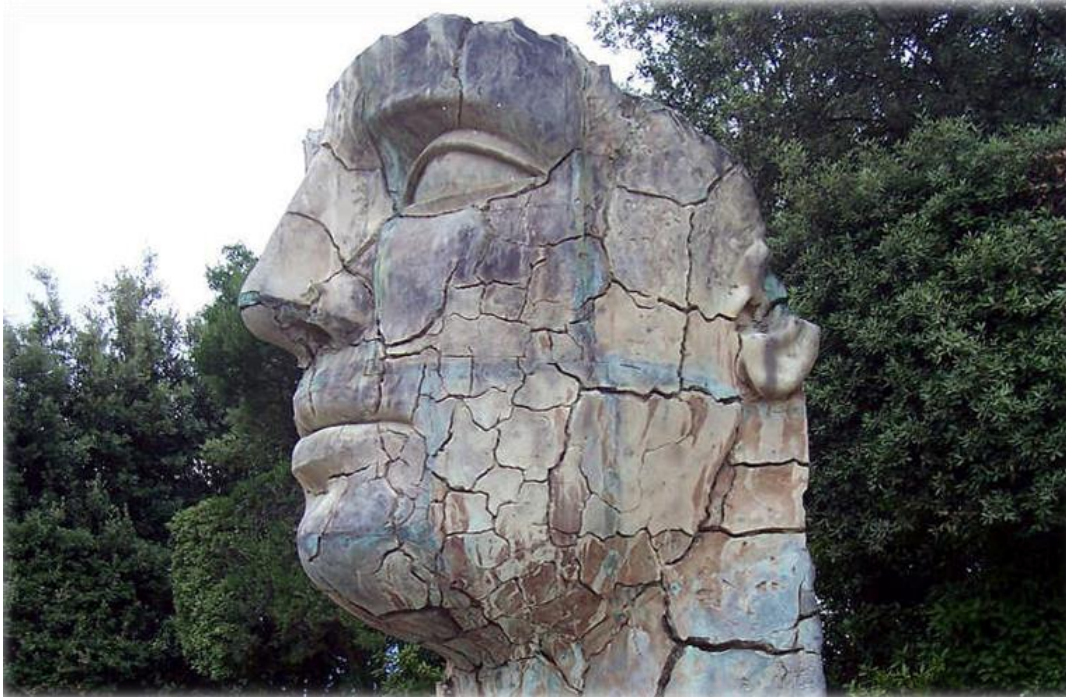
Fig. 17 – Firenze, Giardini di Boboli, Igor Mitoraj, Tindaro screpolato , bronzo, 1998