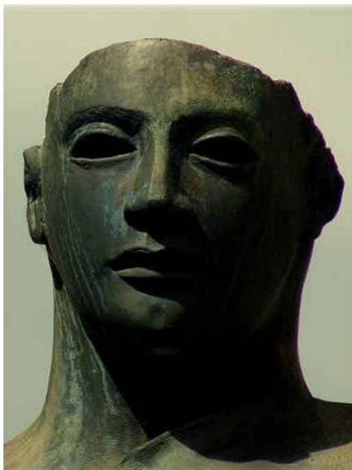
Fig. 3 - Igor Mitoraj, Centauro , bronzo, 1994 particolare