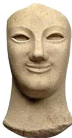
Fig. 4 - Museo archeologico di Morgantina, acrolito di Demetra o Kore , VI sec. a.C. ( http://archeoblog.net/2009/restituiti-dopo-30-anni-gli-acroliti-di-demetra-e-kore )