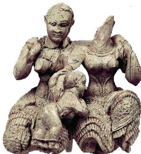
Fig. 2 - Gruppo di tre divinità, avorio, XIII proveniente da Micene, avorio, X Museo Archeologico Nazionale (da La storia dell'Arte , vol. 1, Mondadori Electa, 2006, Milano 2006, p. 476).