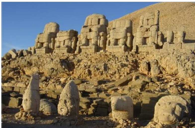
Fig. 18 - Nemrut Dagi (Turchia), tomba e santuario di Antioco I , I sec. a.C.