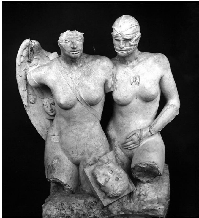
Fig. 1 - Igor Mitoraj, Nascita di Venere , bozzetto, gesso, 1991