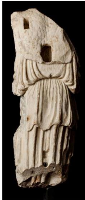
Fig. 6 – Athena Nike , marmo bianco pario, V sec. a.C., Roma, Fondazione Sorgente Group