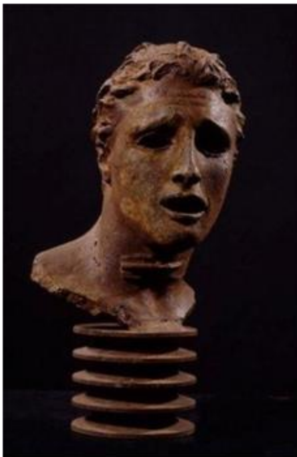
Fig. 14 – Igor Mitoraj, Aèdo , ghisa, 1995