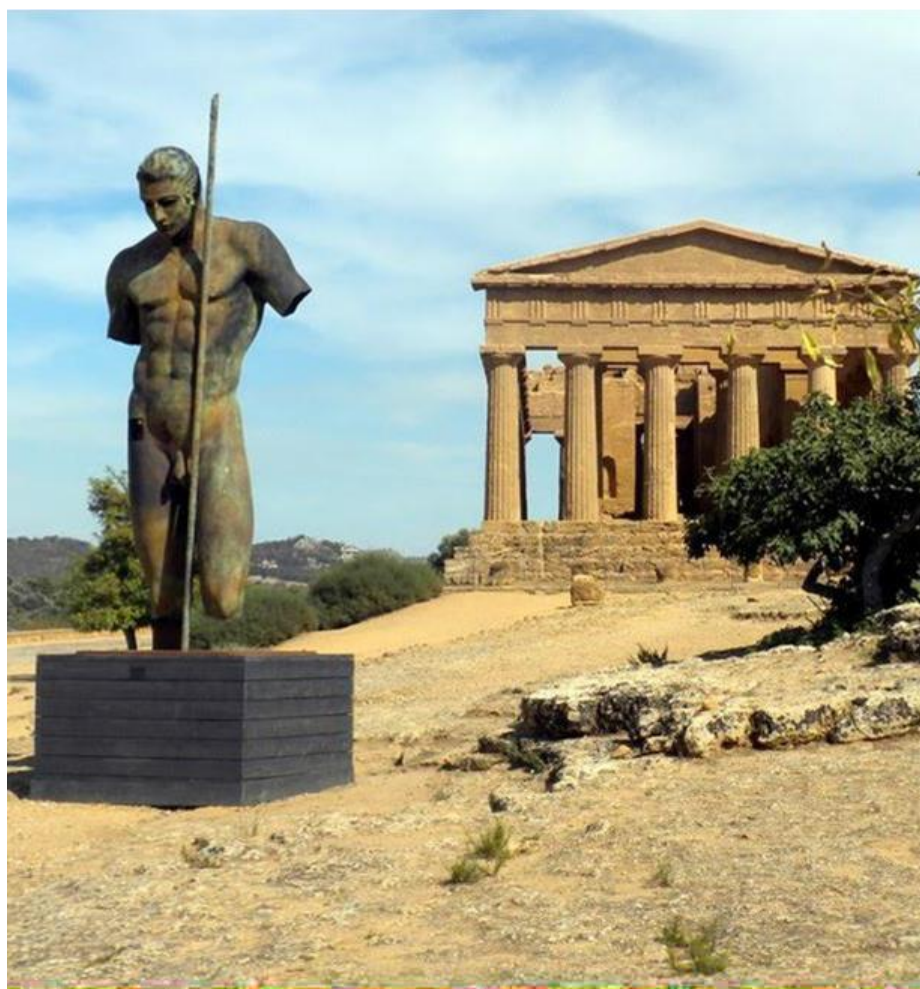
Fig. 13 - Agrigento, Valle dei templi (2011), Igor Mitoraj, Dedalo , bronzo, 2010 (da http://www.panoramio.com/photo/65905807 )