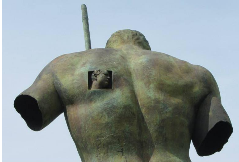
Fig. 5 - Igor Mitoraj, Dedalo , bronzo, 2010