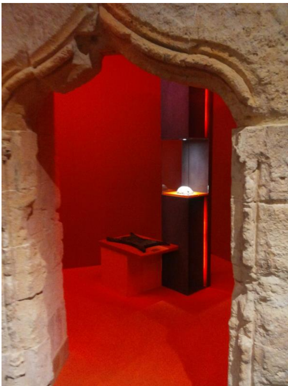
Fig. 4 – Cagliari, Mostra Eurasia”, sezione Rivoluzionemetalli . Particolare con lingotti in rame, Civico Museo Archeologico “Le Clarisse”, Ozieri, e Depositi Soprintendenza Archeologia della Sardegna.