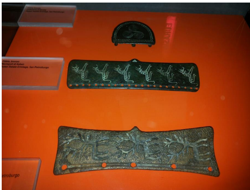
Fig. 5 – Mostra “Eurasia”, sezione Rivoluzionemetalli . Particolare con fibbie in bronzo, Museo Statale Ermitage, San Pietroburgo.

“Eurasia. Fino alle soglie della Storia” (Tiziana Ciocca)