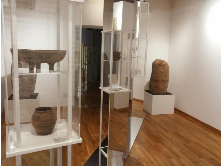
Fig. 3 – Cagliari, Mostra “Eurasia”, sezione Poterevanitas.