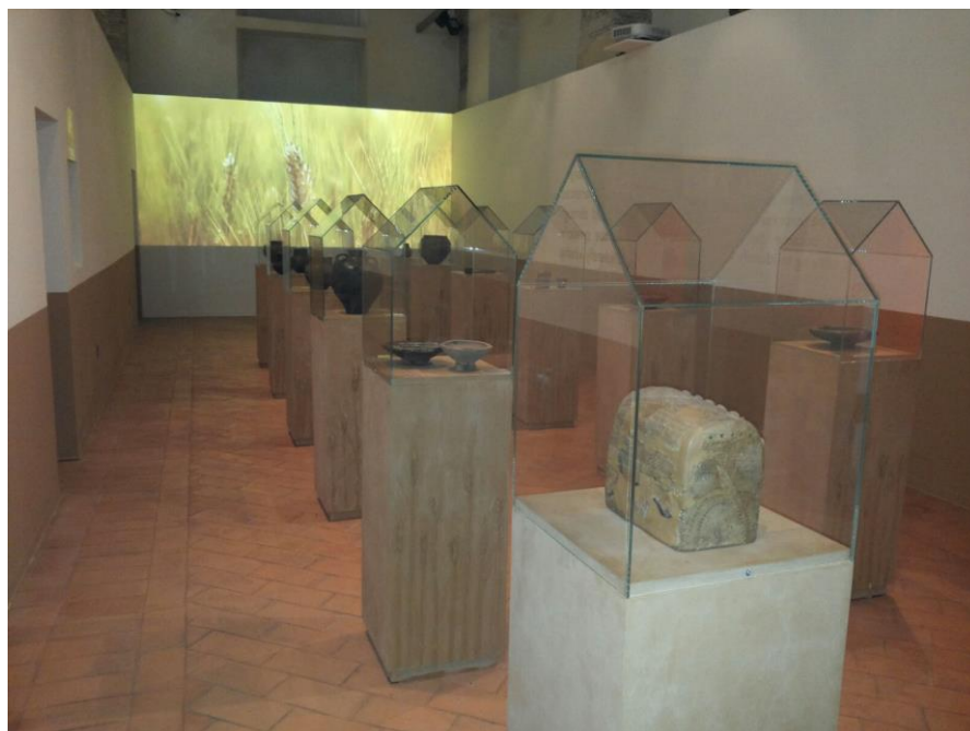
Fig. 2 – Cagliari, Mostra "Eurasia", sezione Tuttigiorni.