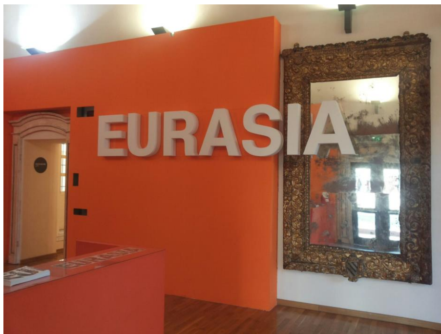
Fig. 1 – Cagliari, Mostra "Eurasia", ingresso.

"Eurasia. Fino alle soglie della Storia" (Tiziana Ciocca)