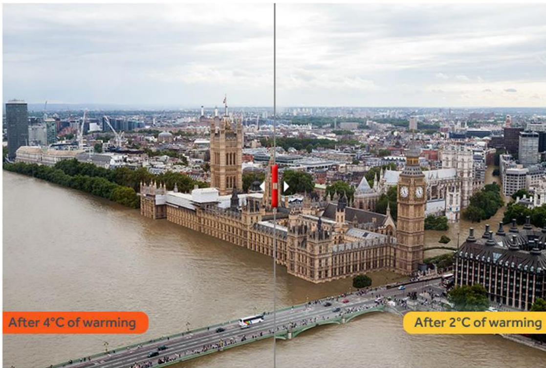
Fig. 2 - Nicolaj Lamm, London, 2015 (da Strauss 2015).