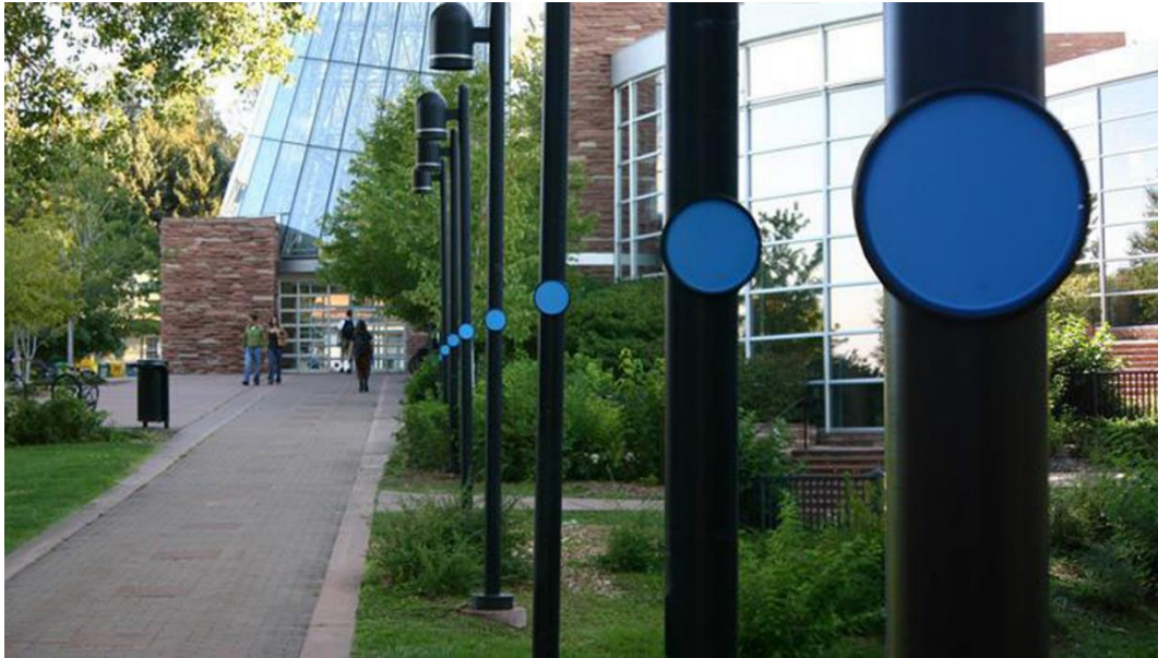
Fig. 1 - Mary Miss, Connect the dots: mapping the high water, Hazards and history of Boulder creek , 2007 (da Renderson 2007)