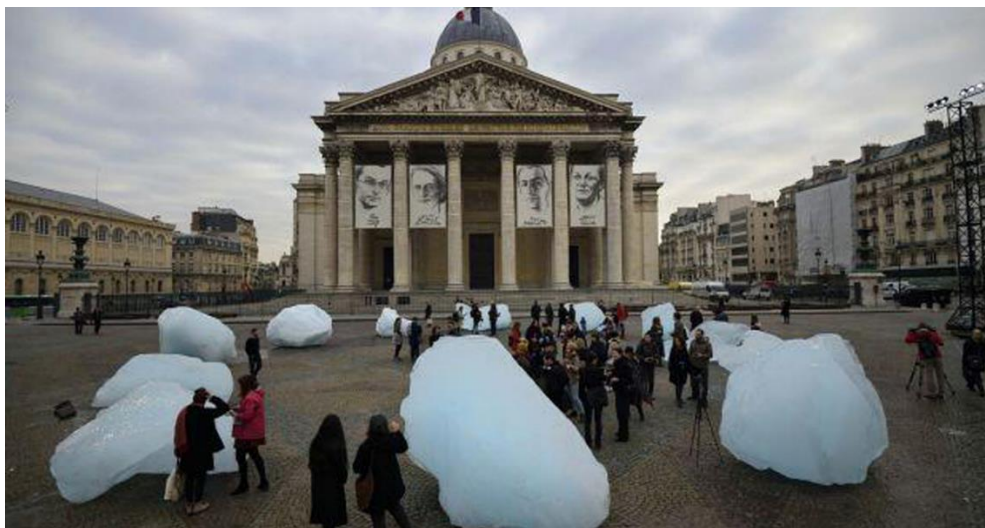
Fig. 4 - Olafur Eliasson, Ice Watch , 2015, Place du Panthèon