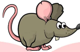
Gambar 2 Karakter Tikus

memiliki selera makan yang besar, tikus adalah pesenam kecil, tikus memiliki jangka hidup yang relatif singkat, tikus sangat banyak menyebarkan bakteri dan kuman, dan yang paling mengancam adalah satu tikus bisa berubah menjadi banyak tikus, semakin banyak tikus tersebut, semakin bertambah juga permasalahan kita[5].