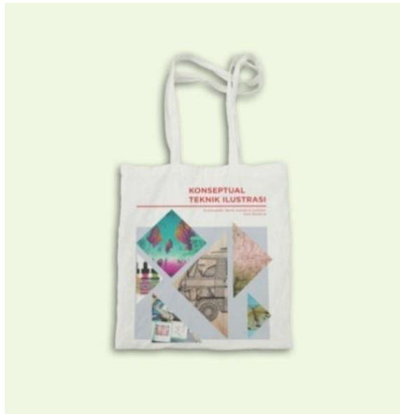
Gambar 11 Contoh desain Totebag sebagai Merchandise buku Konseptual Teknik Ilustrasi