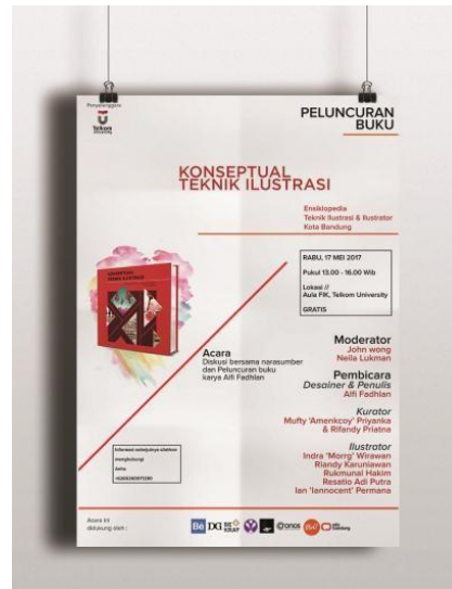
Gambar 10 Contoh desain Poster dan pengaplikasiannya pada pusat keramaian