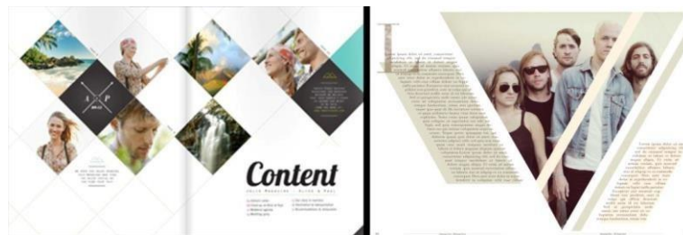
Gambar 5 Contoh beberapa Geometric layout design