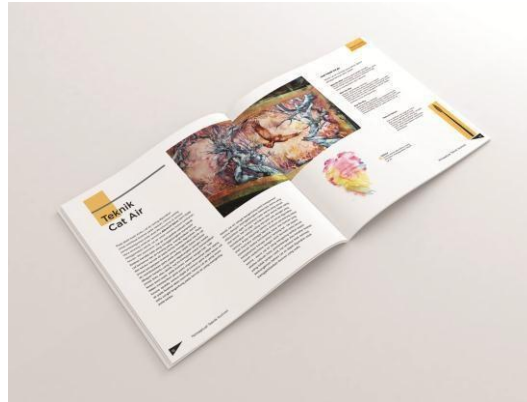
Gambar 7 layout pada halaman buku Konseptual Teknik Ilustrasi

Desain layout yang dirancang dalam buku Konseptual Teknik Ilustrasi tidak terlalu rumit dengan menggunakan warna halaman dasar putih yang bertujuan agar pembaca mudah dalam menikmati isi buku. Penggunaan bidang – bidang persegi berwarna bertujuan untuk menampilkan tulisan singkat dari isi konten utama yang dibentuk dalam sebuah bingkai berbentuk kotak. Dan visual yang digunakan berupa foto media alat dan karya ilustrasi dari ilustrator kota Bandung.