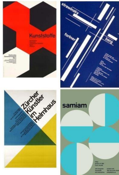
Gambar 4 Contoh desain cover

Dalam mengkomunikasikan informasi kepada khalayak sasaran dalam media buku maka di butuhnya desain sampul, pada perancangan ini desain sampul yang dirancang oleh penulis menampilkan isi yang terdapat dalam konten buku berbentuk visual dan dihiasi dengan konsep visual geometric art berbentuk bidang segitiga dan beberapa visual berupa foto media alat yang digunakan dalam menggunakan tiap teknik ilustrasi,. Tujuan menggunakan konsep desain sampul Geometrical layout adalah agar target audiens paham dengan pembahasan yang ada didalam buku dan memiliki nilai daya tarik untuk membaca.