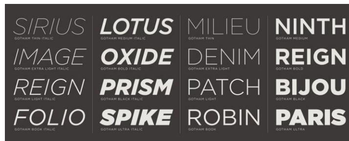
Gambar 3 Contoh font Gotham