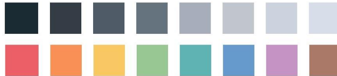
Gambar 1 Contoh warna lembut (sumber : Data pribadi)

Warna yang digunakan dalam perancangan buku “Konseptual Teknik Ilustrasi” ini menggunakan warna – warna yang memiliki kesan lembut, hal ini bertujuan agar pembaca mudah paham dengan isi konten yang terdapat dalam buku, dan juga karena nantinya terdapat halaman yang memuat konten tentang portofolio dari ilustrator yang menggunakan banyak warna di setiap karyanya. Warna yang digunakan berbeda di setiap bab halaman dan setiap pembahasan tentang ilustrator.