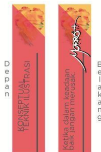
Gambar 8 layout Bookmark pada buku Konseptual Teknik Ilustrasi

Adapun Bookmark sebagai penanda buku, menggunakan visual warna merah yang sesuai pada sampul buku serta adanya quote dari ilustrator pada bagian belakang bookmark agar target audiens dapat termotivasi untuk membuat karya ilustrasi.