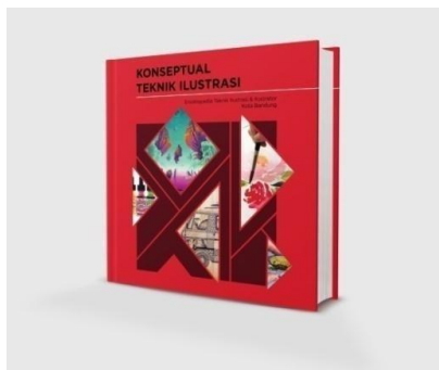
Gambar 6 Sampul buku Konseptual Teknik Ilustrasi

Pada bagian sampul menggunakan visual yang menampilkan perwakilan isi konten buku berupa teknik ilustrasi, karya ilustrator, media, dan medium ilustrasi yang menegaskan bahwa perancangan ini merupakan buku pengetahuan mengenai hal –hal yang meliputi dari ilustrasi dan ilustrator kota Bandung dengan konsep buku yaitu geometric layout dengan penempatan bidang dan garis tersebut berjenis Asymetrical yang tidak sejajar suatu bidang dengan yang lainnya, serta menggunakan warna dasar merah yang menegaskan bahwa buku ini sebagai media referensi di khususkan untuk ilustrator muda agar dapat berkarya lebih produktif.