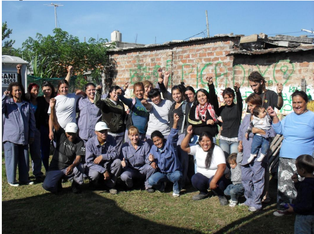
Post - asamblea de cooperativistas del PAT Fotografía tomada por el MTD – JB – Las Colinas Abril 2011