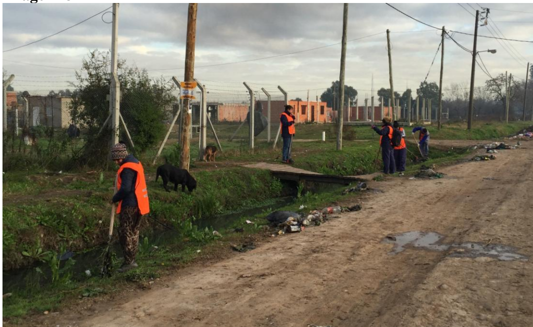
Cooperativa PAT: Limpieza del canal Huergo Fotografía tomada por el MTD – JB – San Agustín Mayo 2012