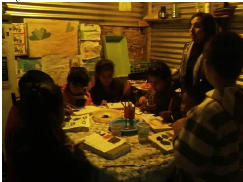
Taller de plástica Junio 2012