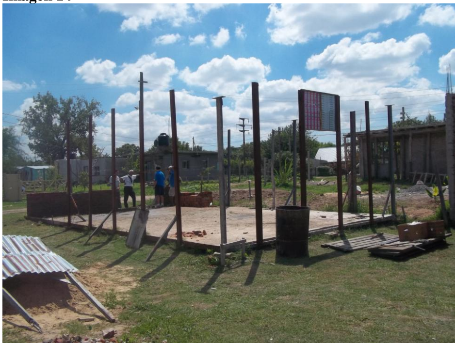
Salita en construcción Fotografía tomada por el MNS – Longchamps Abril 2012