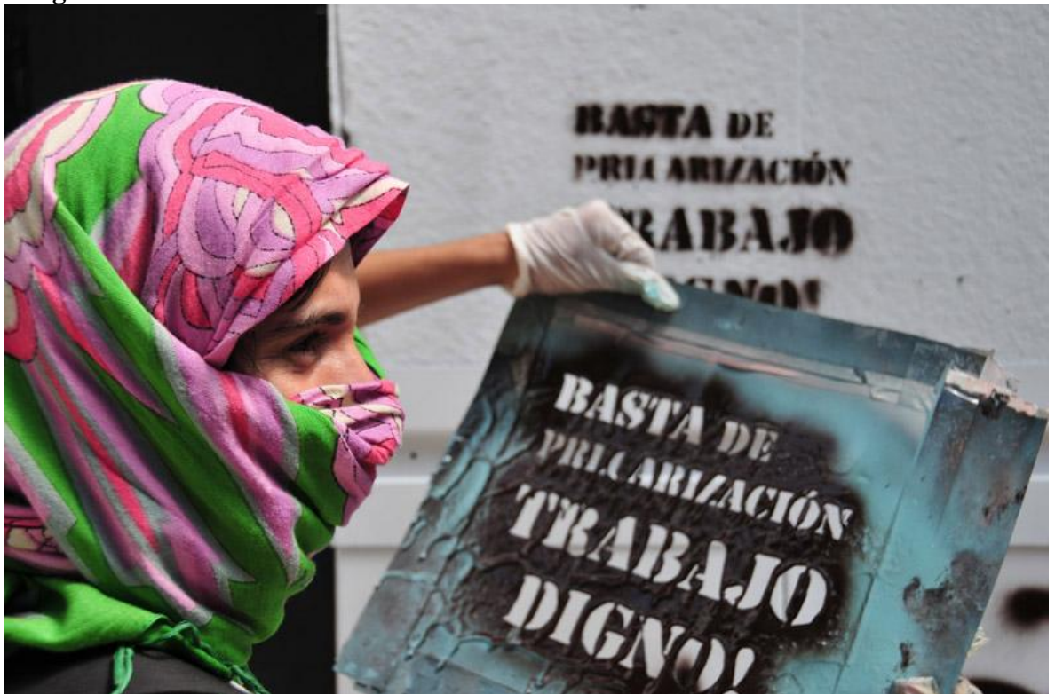
Marcha y acto frente al Ministerio de Trabajo de la Nación 14 de Marzo 2011