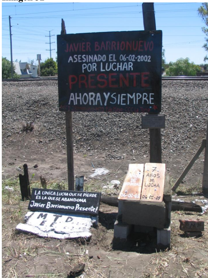
Monolito conmemorativo de Javier Barrionuevo Fotografía tomada por el MTD - JB Febrero 2011