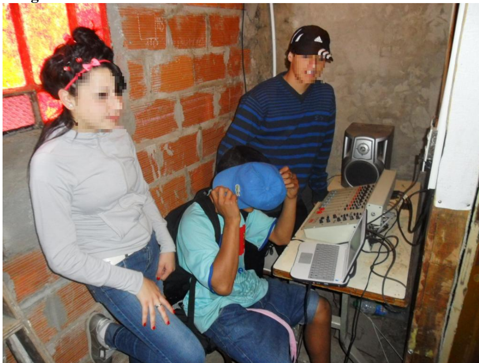
Taller de radio Fotografía tomada por el MTD-JB – Las Colinas (intervenida) Mayo 2011