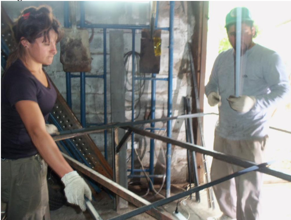
Productivo herrería Fotografía tomada por el MTD – JB – Las Colinas Mayo 2010