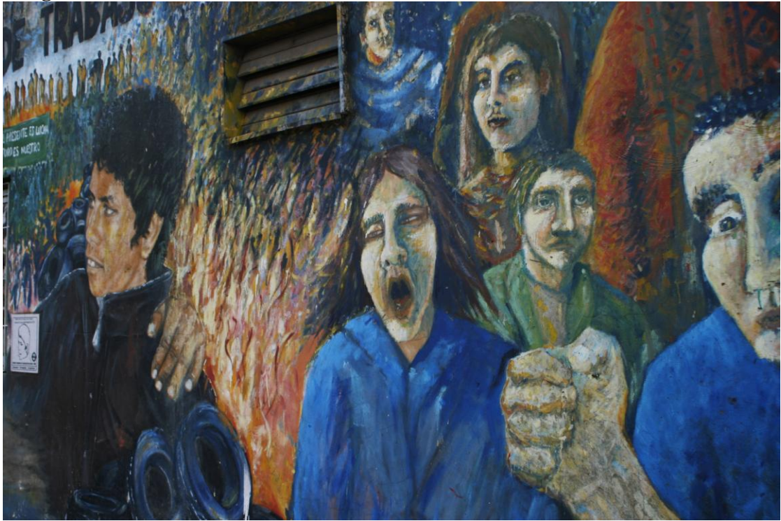
Mural conmemorativo de Norberto Salto Fotografía tomada por el MNS – Claypole Mavo 2012