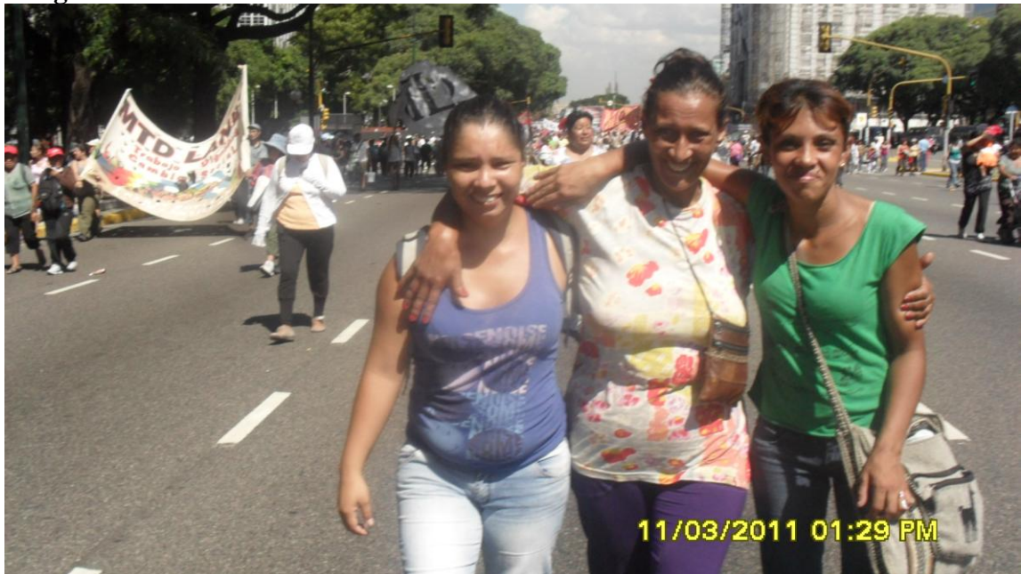
Marcha a Desarrollo Social Marzo de 2011