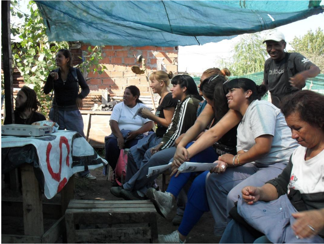
Asamblea de cooperativistas del PAT Fotografía tomada por el MTD – JB – Las Colinas Abril 2011