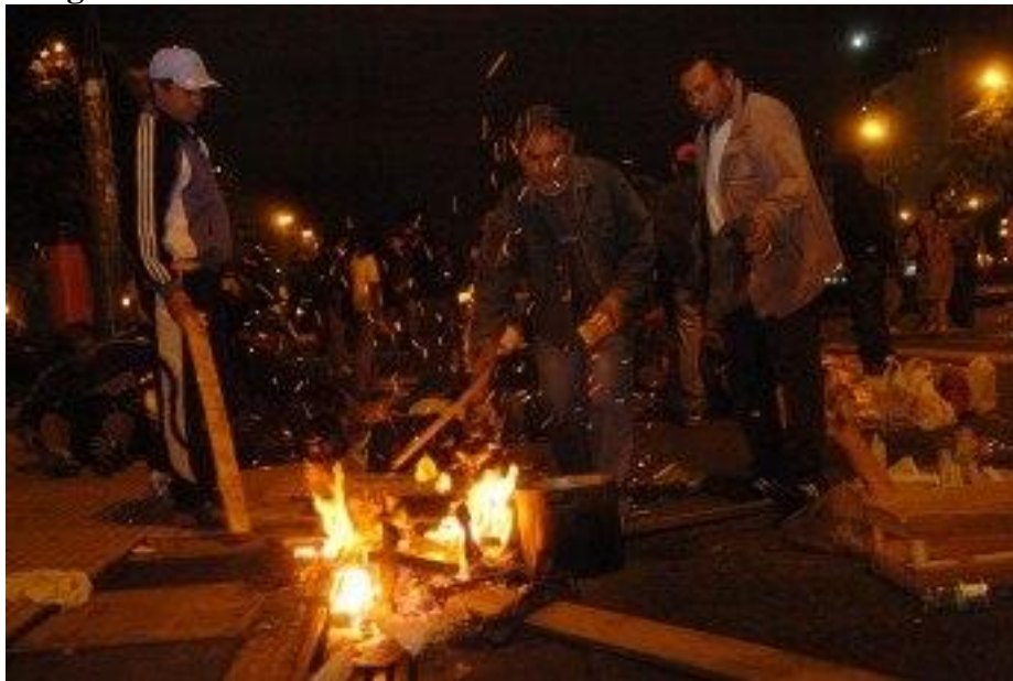
“LA NOCHE. Piquete en la Av. 9 de Julio gente acampando y olla popular.” Clarín – 3/11/2009