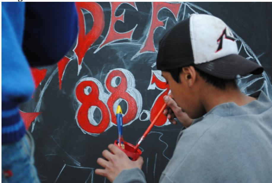
La radio Fotografía tomada por el MTD-JB – Las Colinas Junio 2010