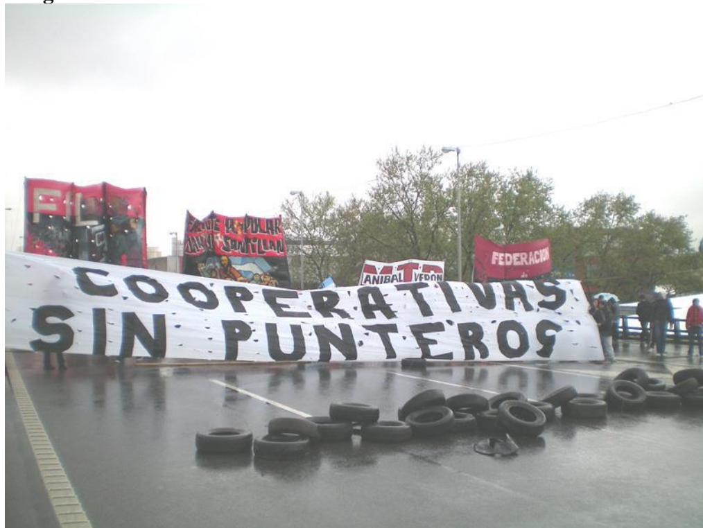
Jornada de cortes simultáneos S/D 22 de septiembre de 2009