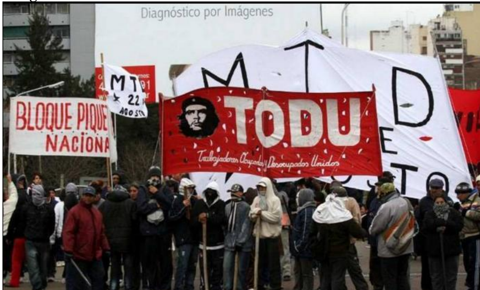
“CORTE. Integrantes de organizaciones sociales reclaman por aumento en los montos de las asignaciones de los planes. (DyN)” Clarín – 24/08/2011