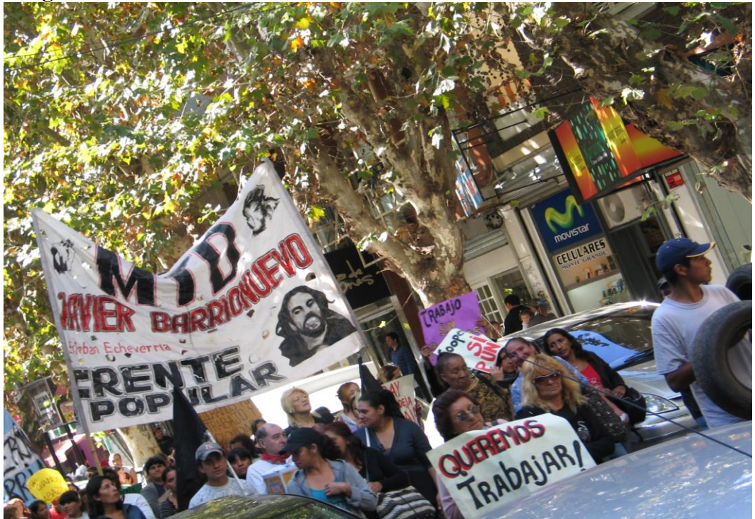
Marcha Monte Grande – “Echeverría No Trabaja” 21 de octubre de 2010