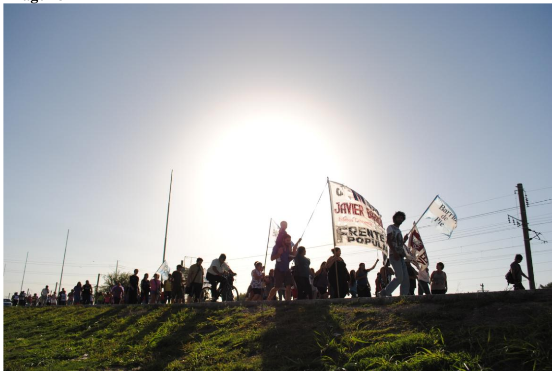
Marcha hacia el monolito. Aniversario asesinato de Javier Barrionuevo Febrero 2011