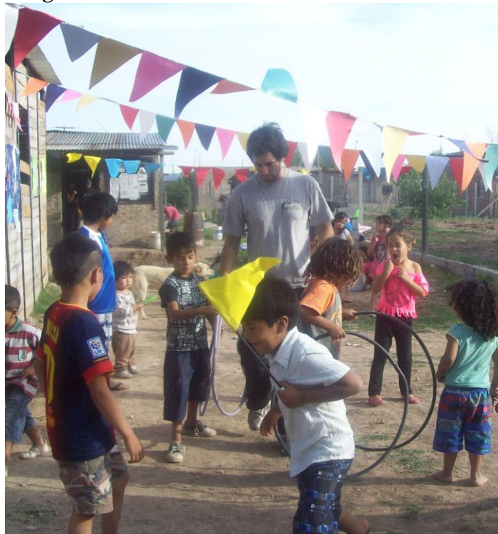
Día del niño y la niña. Fotografía tomada por el MNS – Longchamps Agosto 2012