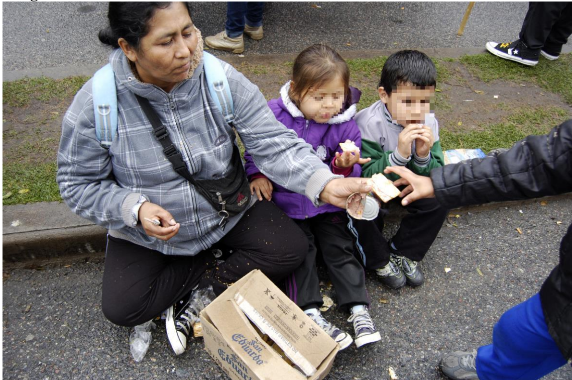
Concentración frente a Desarrollo Social Marzo 2010