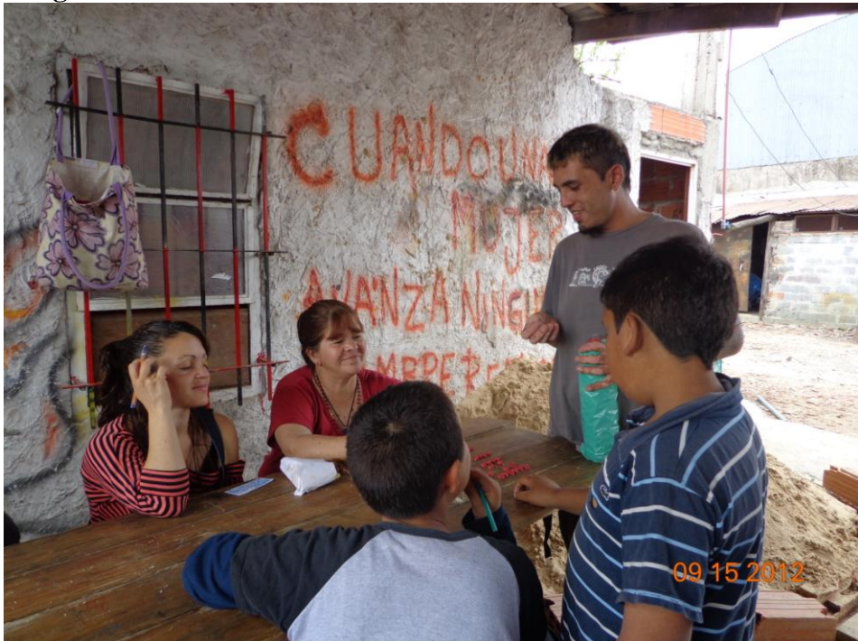
Bingo Fotografía tomada por el MTD – JB – Las Colinas Septiembre 2012