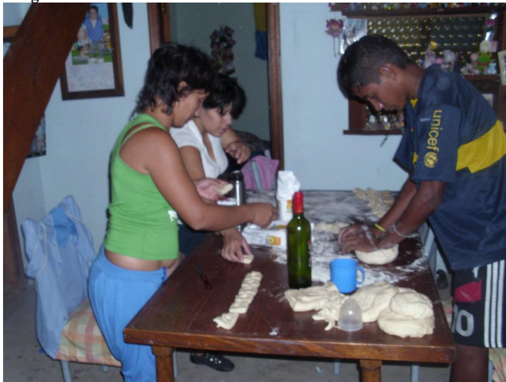
Productivo panadería Junio 2012