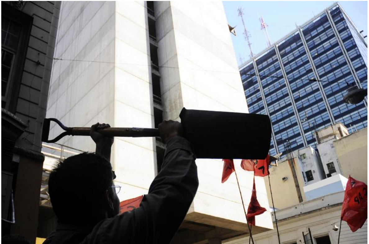
Marcha y acto frente al Ministerio de Trabajo de la Nación 14 de Marzo 2011