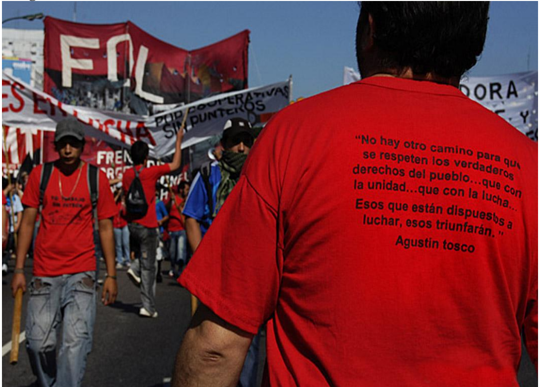
Marcha a Desarrollo Social 1° de Mayo de 2010