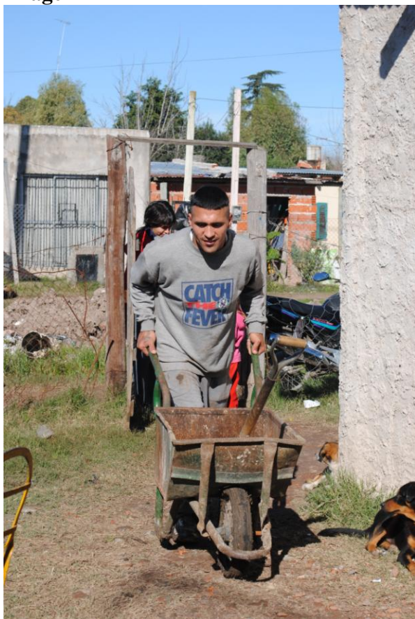
Cooperativa PAT: trazado de veredas Fotografía tomada por el MTD – JB – Las Colinas Mayo 2010