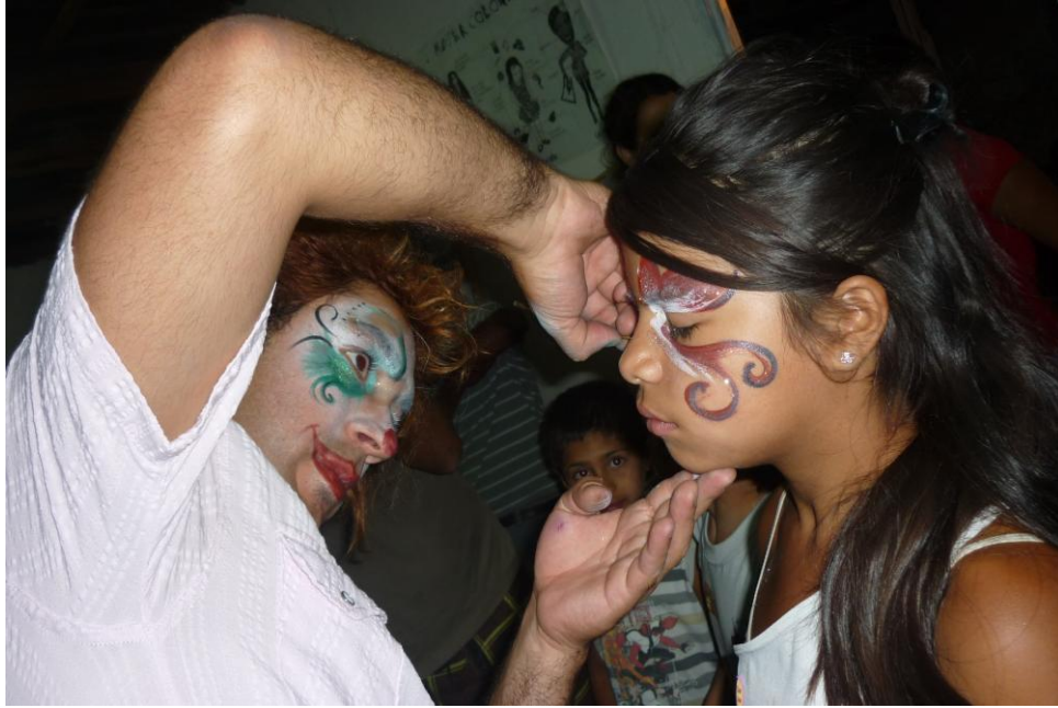
La Murga Fotografía tomada por el MTD – JB – Las Colinas Diciembre 2010