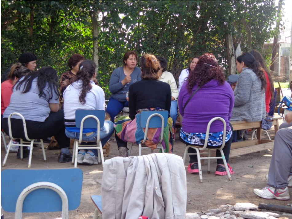
Reunión de género Fotografía tomada por el MNS – Claypole Septiembre 2012