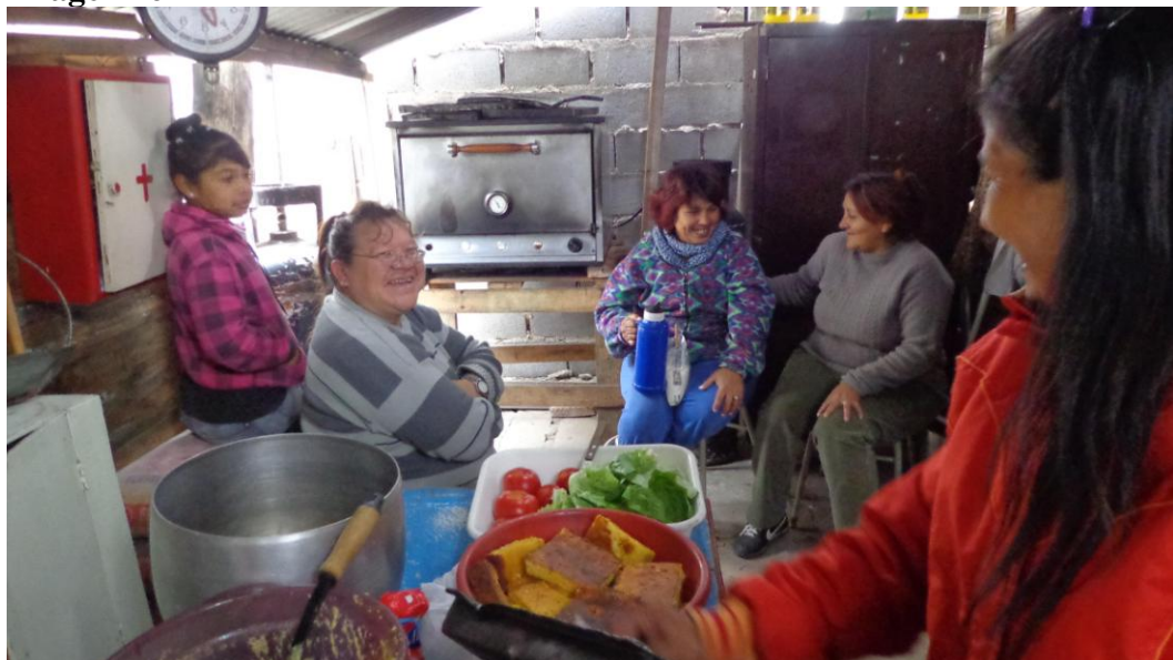
Cocinando la micropolítica Fotografía tomada por el MNS – Longchamps (intervenida) Mayo 2012