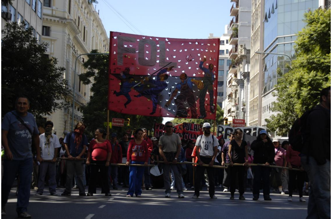
Marcha a Desarrollo Social Marzo 2010