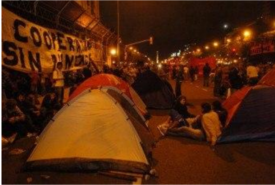
“LA NOCHE. Piquete en la Av 9 de Julio gente acampando y olla popular.”