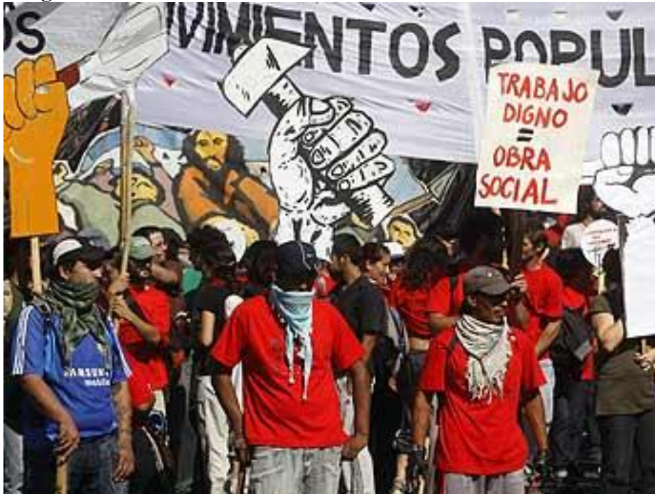
“Los manifestantes interrumpieron por completo el tránsito frente a la sede del Ministerio, donde quemaron algunos neumáticos.” Clarín – 1/05/2010