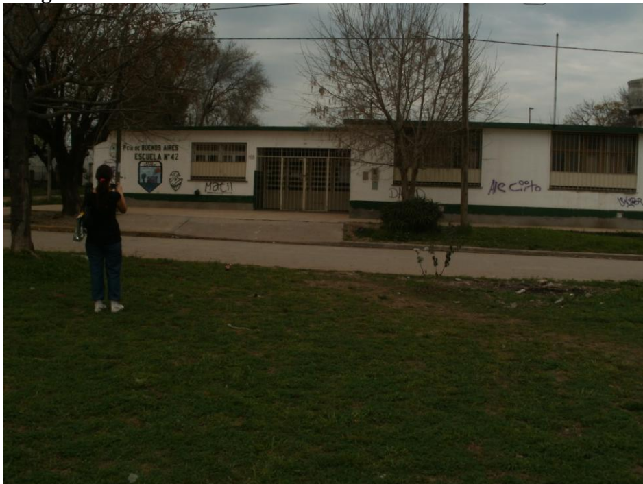
La Escuela Fotografía tomada por el MNS – Claypole Septiembre 2012