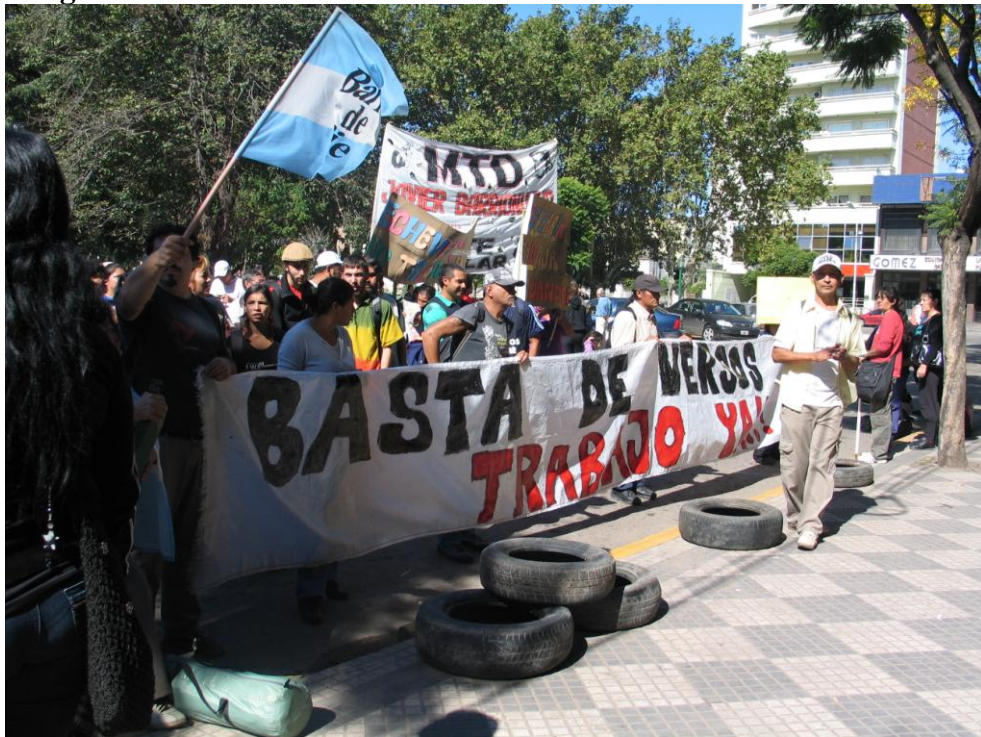
Plaza de Monte Grande – “Echeverría No Trabaja” 21 de octubre de 2010