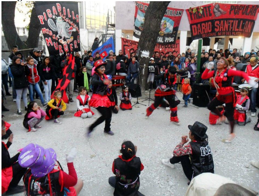
Murga Picadillo Fotografía tomada por el MTD – JB S/F