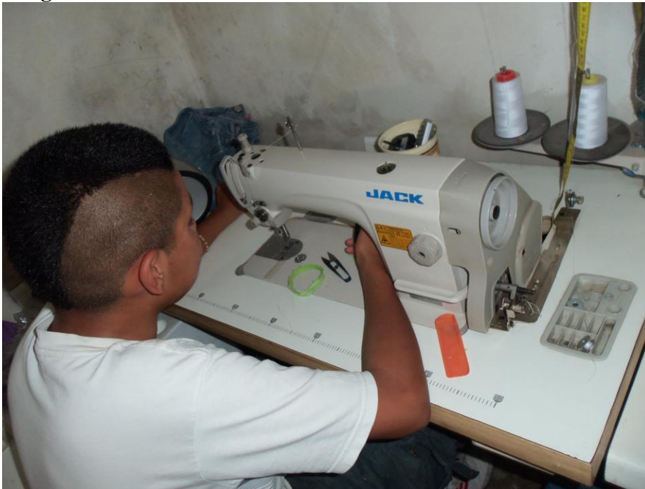
Productivo textil Fotografía tomada por el MTD – JB – San Agustín Mayo 2010