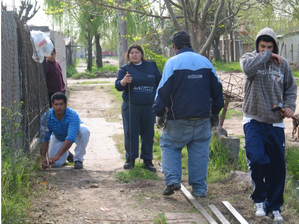
Cooperativa PAT: trazado de veredas Fotografía tomada por el MTD – JB – Las Colinas Mayo 2009