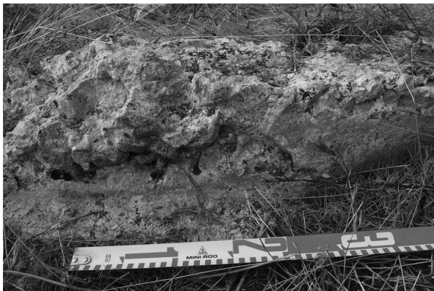
FIGURA 2. Opus caementicium revestido de una capa de opus signinum

Lo más probable es que el acueducto tuviera algún tipo de sistema de cubrición, según Vitruvio ( Los diez libros de la Arquitectura , VIII, 6), para proteger el agua del Sol. En nuestra opinión el revestimiento sería más encaminado a evitar impurezas, inundaciones, uso indebido o la acción de animales. El empleo del opus caementicium sin cubierta fue apuntada por Lugli (1959, 32) como signo de antigüedad en Roma, previo al mandato de Claudio. En la vecina ciudad de Segóbriga, tanto Almagro (1976) como Morín (2014, 228) pudieron documentar la presencia de ímbrices como elementos de cubrición del specus . Éste último destaca no sólo la abundancia de tejas, sino el alargamiento de las aletas para afianzar su base. En el caso del acueducto de Driebes, no hemos encontrado materiales en superficie que permitan conjeturar en esta línea, aunque es una opción válida. Por otra parte, vista la abundante presencia de lajas en el entorno inmediato y en todo el término, no sería descabellado pensar en la posibilidad de que al menos en algunos tramos estuviese cubierto de éste modo, caso del acueducto de Almuñecar (Sánchez 2015, 60) o Huelva (Sánchez y Martínez 2016, 45).