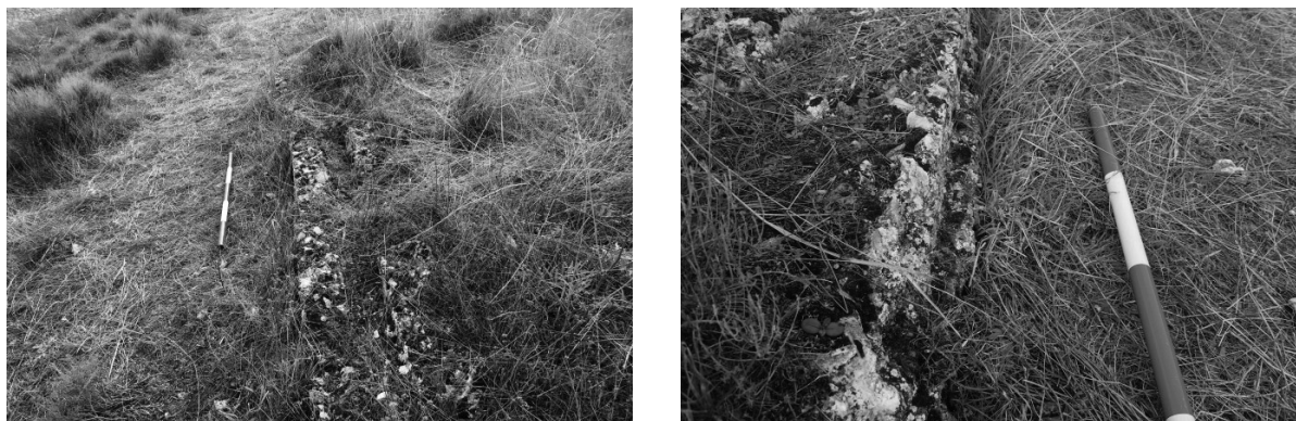
FIGURA 1. a) Detalle de uno de los tramos del acueducto. b) Marca del reborde creado por el encofrado de madera

Responde al tipo de acueducto definido por Vitruvio como de albañilería ( Los diez libros de la Arquitectura , VIII, 6). Para su cimentación se llevaría a cabo una zanja, siendo flanqueada en ambos lados por madera para ejecutar un encofrado. Cada tongada era rellena de opus caementicium con un travesaño cuadrado en el centro que conformaría el negativo del specus , o caz propiamente dicho. Tras presionar fuertemente la mezcla y dejar que fragüe a la intemperie se retirarían los listones que hacían de cajeadado. Este proceso requería un personal especializado, ya que la composición y ejecución de la argamasa si no se realizaba correctamente podía provocar importantes fisuras, tal y como ha demostrado la arqueología experimental (Calero 2006-07). No se ha podido constatar la marca de las tongadas del encofrado, pero si su retirada con la presencia de una rebaba en la parte inferior (fig. 1b). En algunos tramos parece incluso que el peso y la presión exterior del opus caementicium ha hecho que se venciera hacia fuera la mezcla antes de secarse en el encofrado, creando una sección más abierta que la cuadrangular.