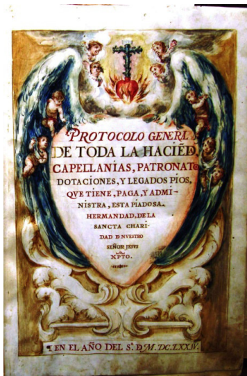
Fig. 3 Protocolo de la Caridad, 1674