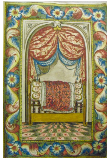
Fig. 4 Protocolo de la Casa Cuna, 1699