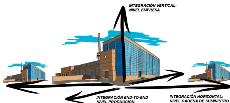
Figura 2: Ejes de la Industria 4.0.

La ingeniería integral (end-to-end) en todo el ciclo de vida del producto describe la interconexión y digitalización inteligente en todas las fases del ciclo de vida del producto: desde la adquisición de la materia prima hasta el sistema de fabricación, el uso del producto y el final de la vida del producto (Stock & Seliger, 2016).