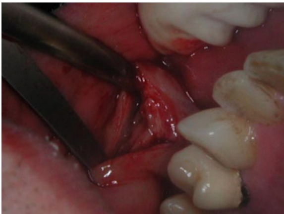
Fig. 2. Mediante la separación de los bordes de la herida se favorece la creación de una fístula salival como forma de cicatrización.

procedió a la incisión sobre la zona indurada (Figura 1, C), y una simple presión en la mejilla a este nivel, hizo que el sialolito emergiera a través de la incisión (Figura 1, D). Comprobamos que el tamaño del sialolito era el esperado y detectado en la radiografía.