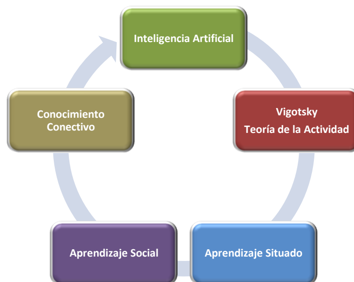
Figura 2: Influencias sobre el Conectivismo

La construcción de significado y la formación de conexiones entre comunidades de profesionales son algo importante para el Director de Proyectos (Clinton, Lee & Logan, 2011). Que ha de aprender a adaptarse en un entorno profesional cambiante y tener la capacidad de reconocer y ajustarse a esos cambios que se producen. Se ha de entender la formación como un proceso de auto-organización, llegando a ser capaz de formar conexiones entre fuentes de información para poder crear patrones de información útiles que le irán acompañando durante todo su ciclo de vida profesional.