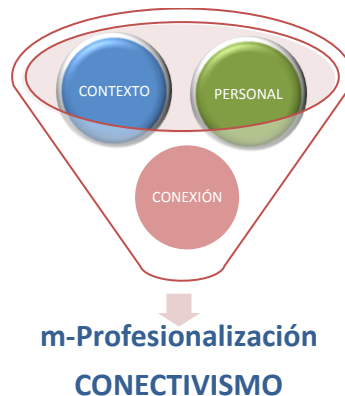
Figura 3: Control de factores para la profesionalización mediante empleo del móvil.