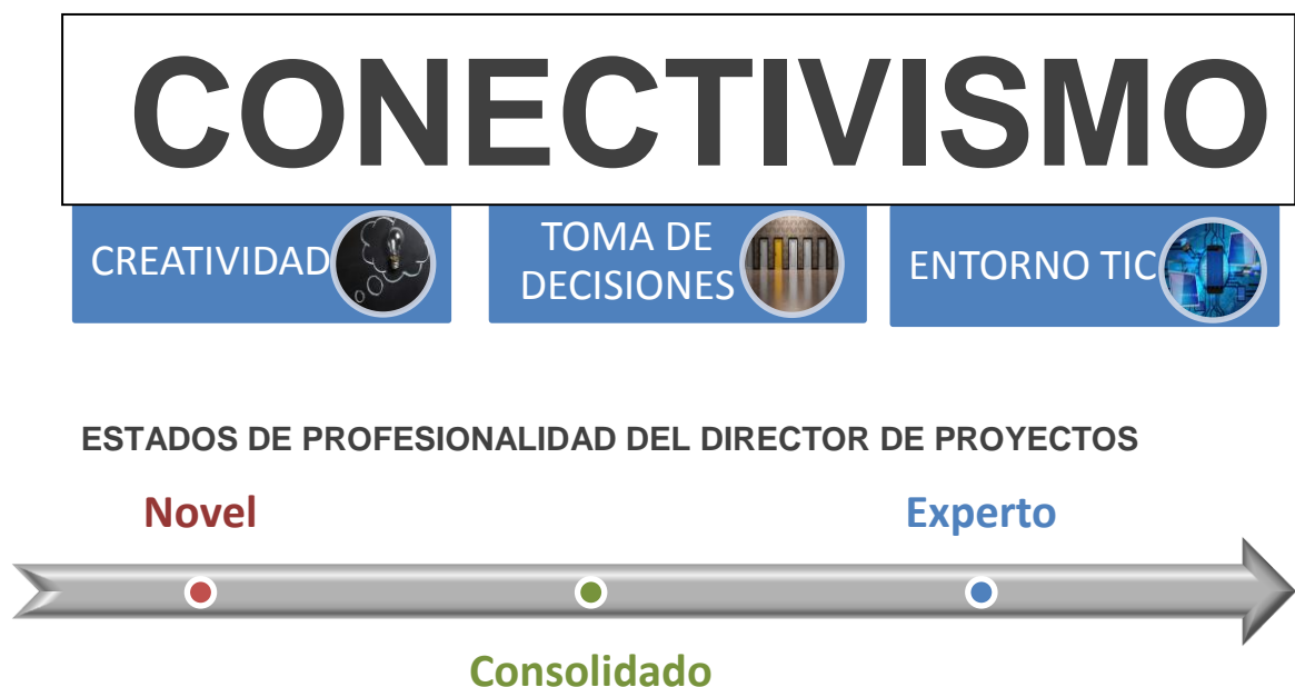
Figura 1: Mejora del perfil profesional del Director de Proyectos

En este nuevo marco, en el que las redes adquieren una importancia enorme en un entorno digital en rápida expansión, el Conectivismo establece que la formación ya no es una actividad que se realice a nivel individual, sino que consiste en el proceso de conectar nodos especializados o fuentes de información (Downes, 2012). Pasando a distribuirse a través de redes, por lo que se abre una vía alternativa a la establecida a nivel personal (Siemens, 2004).