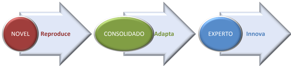
Figura 2: Evolución de los estados de profesionalidad

Los profesionales Expertos a su vez, mediante la realización de posibles proyectos de colaboración con los profesionales Noveles y Consolidados pueden desarrollar nuevas relaciones fructíferas y nutrirse de ideas rompedoras y creativas.