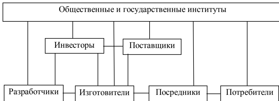
Рисунок 2 – Схема взаимодействия субъектов инновационного процесса

Риски инвесторов в инновации проявляются в виде низкой доходности (нормы отдачи) инновационных проектов, потери (полной или частичной) инвестируемых средств. Причины – см. выше риски производителей.