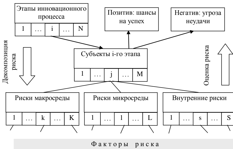
Рисунок 5 – Структура системы «инновационный риск» и направления его анализа

Для этого инновационные риски следует рассматривать как систему, отображенную на рис. 5. Такое представление инновационных рисков позволяет полнее раскрыть их сущность, разработать процедуры его уточненного поэтапного анализа, повысить на этой основе точность и обоснованность принимаемых инновационных решений.