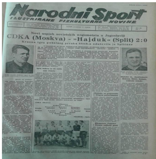
Slika 1: Narodni sport: izvještaj s utakmice splitskog Hajduka i moskovskog CDKA 105

Sovjetski viceprvak i pobjednik kup natjecanja 1945. godine, moskovski CDKA, za destinaciju svoje turneje odabrao je Jugoslaviju, što je izazvalo oduševljenje javnosti i nogometnih domaćina. Moskovski nogometaši odigrali su četiri utakmice pobijedivši beogradske timove Partizan (4:3) i Crvenu Zvezdu (3:1), te splitski Hajduk (2:0). Najjači otpor pružila je reprezentacija grada Zagreba odigravši neriješeno 2:2. 103 Sve su utakmice bile izvrsno posjećene te su se pretvorile „u burnu manifestaciju bratstva i jedinstva slavenskih naroda“. 104