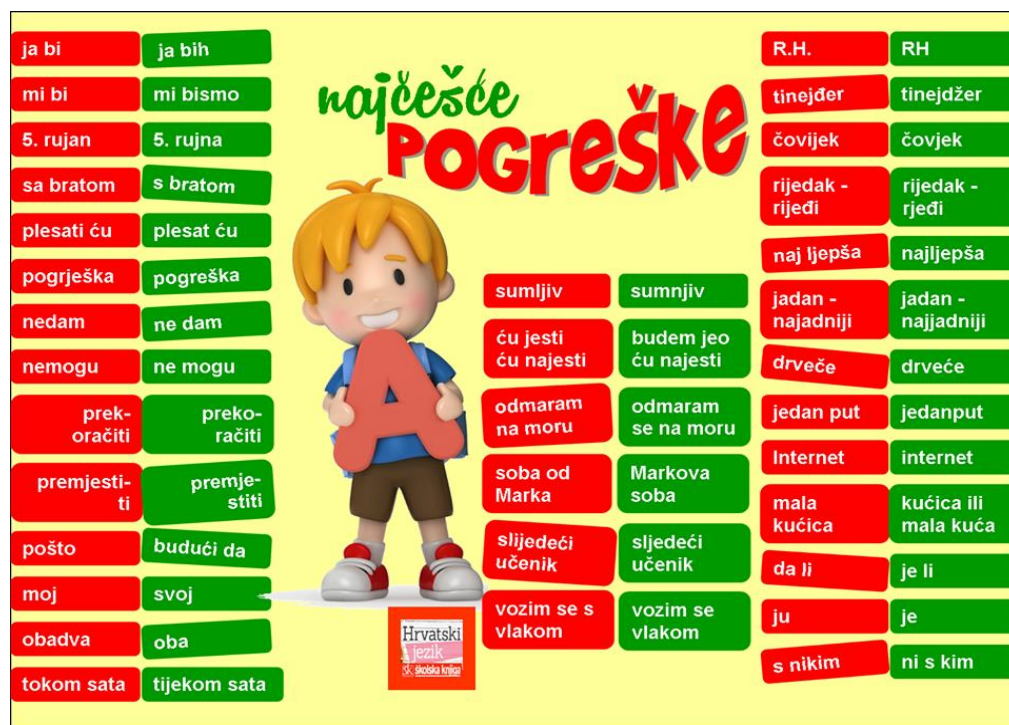
Slika 3: Najčešće pogreške 22