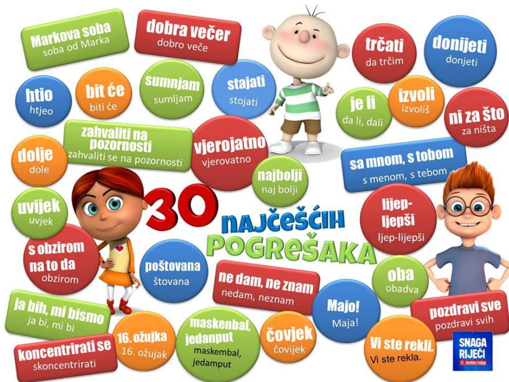
Slika 2: 30 najčešćih pogrešaka 21