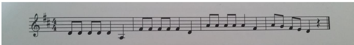
Slika 6. Notni zapis glazbene igre

„Opis glazbene igre: Djeca pjevaju i povlače prst, prste, šake, laktove po čvrstoj podlozi pomičući ih na dojni ritam. Kada pjevaju TRALA, LALA, LA, zavrte dlanove ruku jedne iznad drugih u visini prstiju, prvo u umjerenom tempu pjesme, pa poslije sve brže i brže.“ (Šmit, 2001: 127)