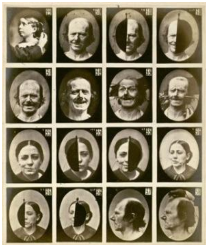
Slika1. Duchenneovi dijapozitivi koje je Darwin koristio u svome eksperimentu o prepoznavanju emocija.

Jedna od široko prihvaćenih klasifikacija koja uključuje univerzalistički pristup opisuje osnovne tipove emocija, koje naziva temeljnim, bazičnim ili primarnim emocijama (Ekman, 1992), što uključuje ljutnju, strah, zadovoljstvo, tugu i gađenje i iznenađenje . Uvidom u dvadeset i jedan pregledni rad vezan uz različite teorijske pristupe o temeljnim emocijama, Schnoebelen je ustanovio pedeset i jednu vrstu različitih emocija, koje su klasificirane kao temeljne 8 . Istraživači najčešće ipak opisuju šest temeljnih emocija, a neki ih nazivaju i univerzalnim emocijama (radost, tuga, strah, bijes, iznenađenje i gađenje) mada se u tom dvadeset i jednom radu najčešće opisuje oko devet temeljnih emocija (Schnoebelen, 4). Najčešće su to: anger, rage, hostility koje navodi 18 autora, fear, fright, terror navodi 17 autora, joy, happiness, elation i enjoyment se spominje u 14 radova, sadness, sorrow, distress i dejection navodi se u 14 radova, disgust u 12, shame u 9, love i tender emotion u 8, anxiety i worry u 7 radova, surprise u 7, a guilt u 6 radova (Schnoebelen, 4). Svakako je bitno istaknuti da postoje dvojbe vezane uz postojanje i vrstu temeljnih emocija, što potvrđuje da i dalje postoji niz nedoumica na tom području (Ortony i Turner 1990).