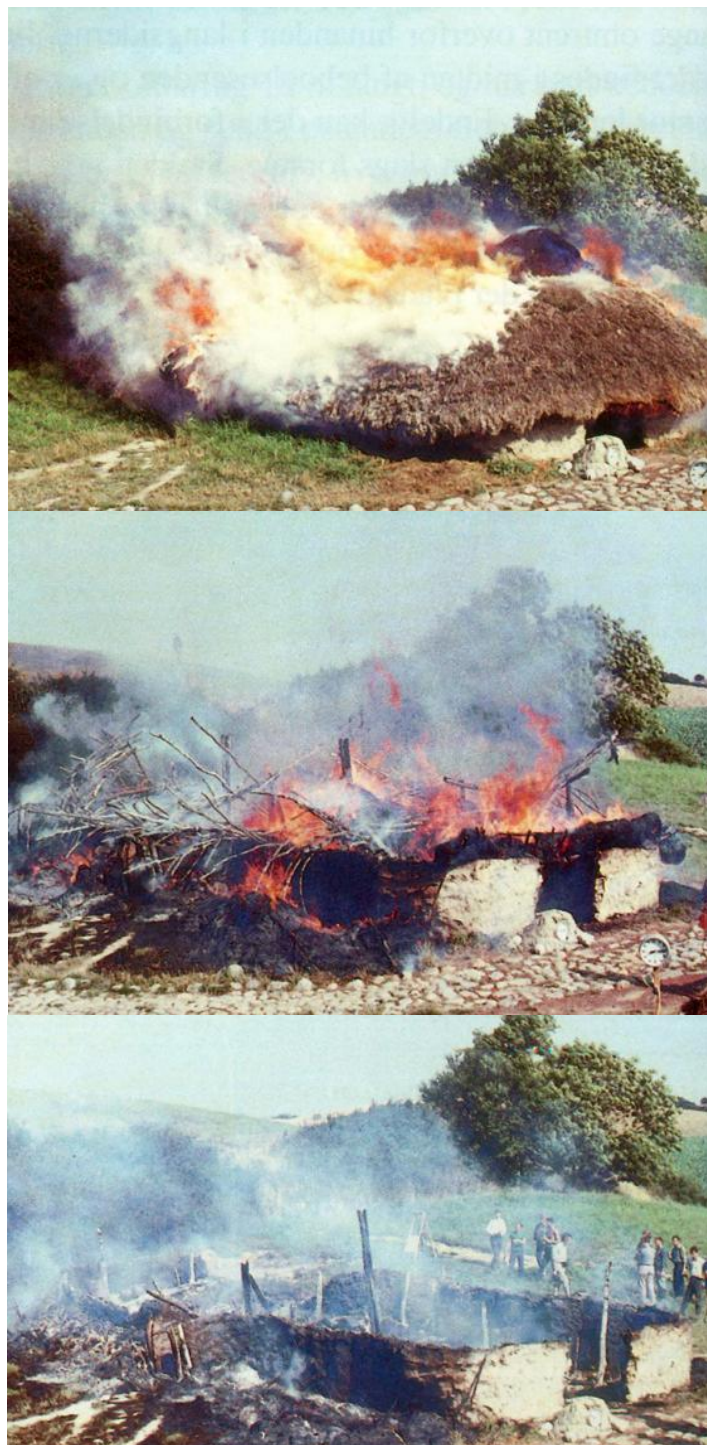
Slika 8 – Kontrolirano paljenje (re)konstruirane prapovijesne nastambe je dobar primjer eksperimenta replikacije procesa formiranja arheološkog nalazišta. Slike prikazuju jedan takav eksperiment proveden u Lejre centru 1967. godine. Svi drveni stupovi i grede su označeni, termometri postavljene po podu i krovu, a stanja urušavanja dokumentirana su fotografskim i mjernim mehanizmima. (Slike iz Meldgaard i Rasmussen 1996)

Predložena je i četvrta razina eksperimentalne replikacije, replikacija sistema . Ona bi obuhvaćala reprodukciju brojnih procesa unutar proučavanog živućeg sustava. Proučavanje oruđa i oružja, materijalnih stvari koje su čovjeku omogućile učinkovitu kontrolu nad prirodnim okruženjem, može dovesti do složenijih