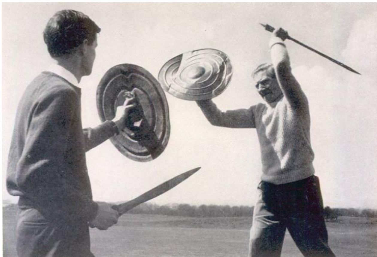
Slika 2 – John Coles (lijevo) prilikom eksperimentalnog testiranja borbenih karakteristika replika brončanodobnih kožnih i metalnih štitova. Metalni štit (desno) bio je posječen u komadiće nakon prvih nekoliko udaraca, dok je kožni štit (lijevo) izdržao višestruke udarce naoštrenih replika mača i koplja te se, usprkos uvriježenom mišljenju, pokazao sposobnim za obavljanje zaštitne uloge u bitci. (Coles 1966, 19.)

Šezdesetih godina dvadesetog stoljeća eksperimentalna arheologija počela se formirati kao zasebno i dinamično područje istraživanja unutar arheološke znanosti. Javna percepcija eksperimentalne arheologije kao neznanstvene i neozbiljne razbibrigje počela se postepeno mijenjati, prvenstveno na temeljima i rezultatima dva istraživačka centra posvećenim znanstvenom provođenju arheoloških eksperimenata: Eksperimentalnog centra Lejre u Danskoj i engleskog Buster Ancient Farm. Početkom šezdesetih godina dolazi i do prvog korištenja i definiranja termina „eksperimentalna arheologija“ u znanstvenoj literaturi od strane Roberta Aschera. Ascher u svom djelu iz „Eksperimentalna arheologija“ iz 1961., u samom začetku stručnog razvoja te discipline, odmah pogađa i danas sveprisutan razlog čestog neprihvatanja i neozbiljnog shvaćanja eksperimentalnih rezultata: nedostatak znanstvene osnove i utvrđene metodologije. Još jedna ključna osoba u uspostavljanju i znanstvenom prihvaćanju eksperimentalne arheologije šezdesetih i sedamdesetih godina bio je i engleski arheolog John Coles, jedan od prvih akademika koji je javno i jasno izražavao potrebu za sistematskim i profesionalnim arheološkim eksperimentiranjem. Svojim značajnim