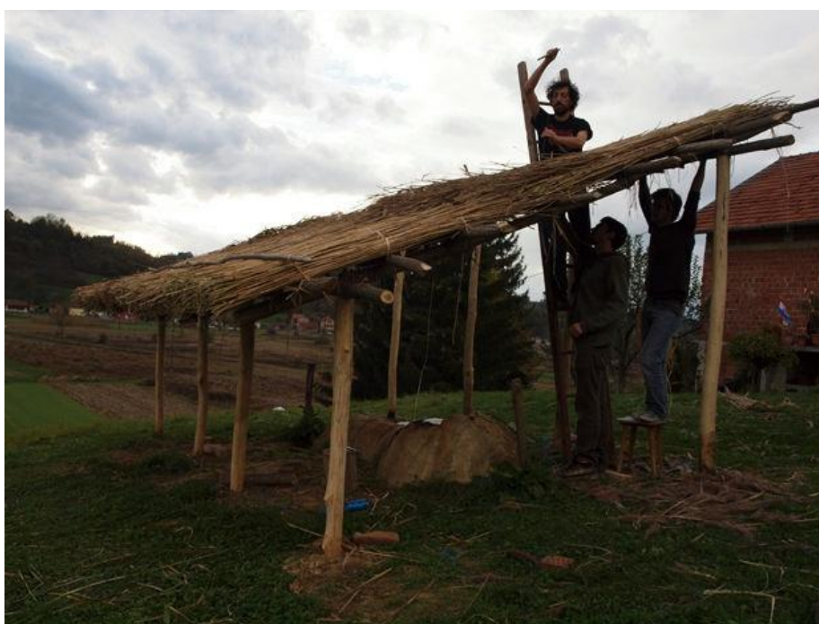
Slika 4 – Pokušaj izgradnje prapovijesnog objekta od čije su konstrukcije preostale samo rupe od stupova u zemlji ne može se smatrati rekonstrukcijom već konstrukcijom. Ne možemo u potpunosti rekonstruirati nešto što ne znamo kako je izgledalo. Na slici su članovi Centra za eksperimentalnu arheologiju iz Zagreba.

Na te se načine pouzdanost i primjenjivost dobivenih rezultata višestruko povećava, a replicirani objekti i procesi podobni su za daljnja istraživanja. Svojstva korištenih naprava i oruđa mogu biti analizirana, kao i utjecaji koje replicirani procesi uzrokuju na njih. Kompleksno i objektivno pitanje uloženog vremena može se uzeti u obzir. No naše je znanje o prapovijesnim i povijesnim tehnologijama ograničeno te tu često leži najveći problem s kojim se osoba koja vrši eksperiment suočava. Ona često nije dovoljno upoznata sa primijenjenim materijalom i tehnikama te se predlaže dijalog i suradnja sa kvalificiranim stručnjacima i iskusnim zanatlijama upoznatim sa procesima u pitanju. Moderan čovjek često nije iskusan u obavljanju raznih „primitivnih“ aktivnosti poput sječe drveća kamenom sjekirom ili izrade nastambi od šiblja te su ranije praktične i iskustvene radnje u svrhu upoznavanja sa materijalom i tehnikama u pitanju također dobrodošle. Detaljne etnografske evidencije aktivnosti poput obrade kamenja, raščišćavanja šuma, gradnje kuća, pečenja keramike i mnogih drugih također pružaju jedinstven uvid u tehnologije prošlosti. Osobe opisane u tim zapisima bile su u potpunosti upoznate sa materijalima u pitanju i tehnološkim procesima vezanim uz iste, te osoba koja vrši eksperiment može uz malo truda imati uvid u veliku količinu već dostupne građe primjenjive u eksperimentalnoj arheologiji. 43