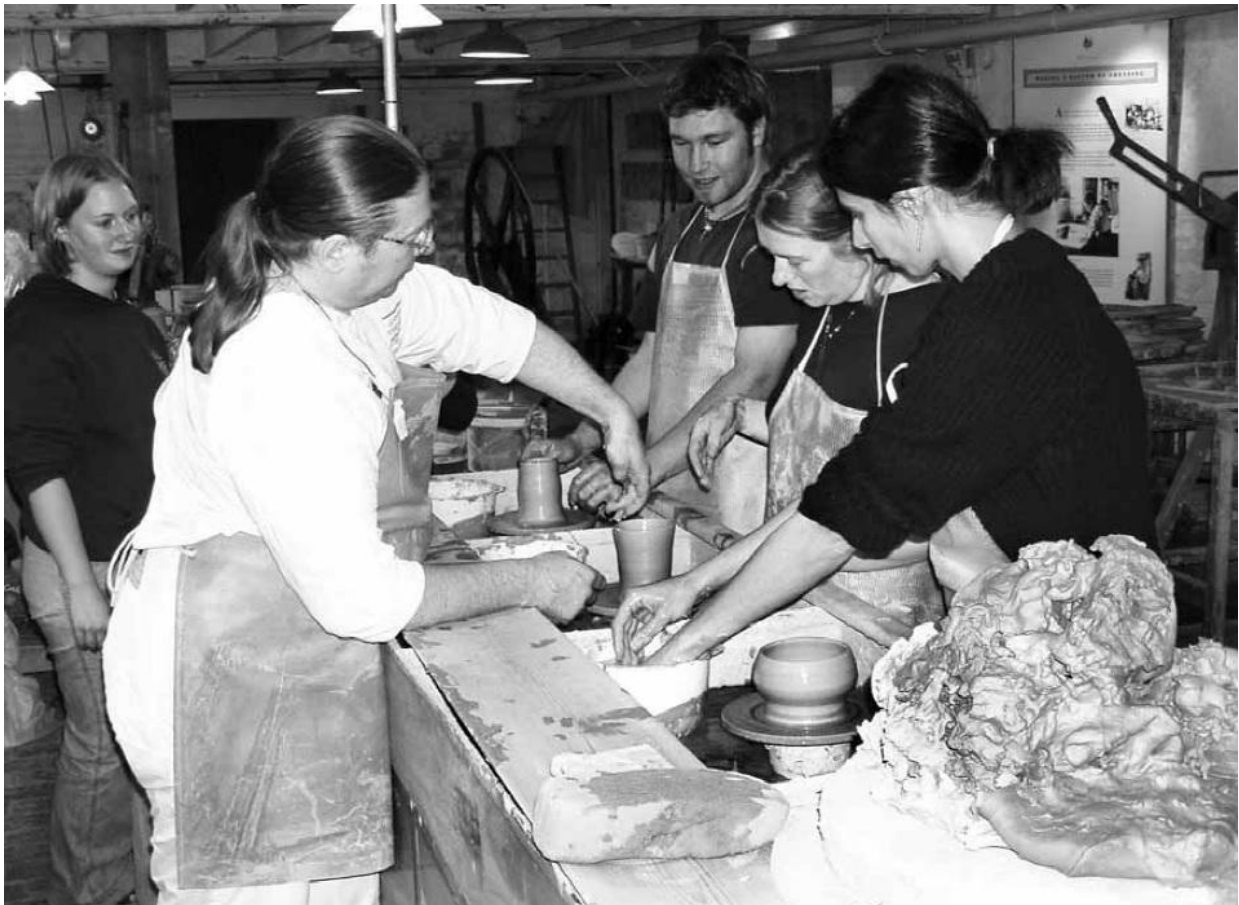
Slika 9 – Izrada replika prapovijesnih keramičkih posuda dobar je primjer iskustvene radnje. Ove radnje, primjenjujući tehnike često nastale ili utvrđene eksperimentalnim metodama, ne teže davanju odgovora na specifična pitanja i ne pridonose znanstvenom arheološkom rasuđivanju. Dobar su način upoznavanja sa materijalom i tehnikama potrebnim za provođenje znanstvenih arheoloških eksperimenata. Na slici je grupa studenata sa diplomskog studija eksperimentalne arheologije Sveučilišta u Exteru. (Slika iz Outram 2004)

znanstvenog istraživačkog rada, edukacije, i turizma. Svaka od tih aktivnosti na svoj način pridonosi razvoju arheologije i može se definirati zajedničkim nazivnikom, no sa jasnim distinkcijama na umu. Cilj eksperimentalne arheologije nije litička alatka niti zadovoljni posjetitelj; cilj mora uvijek biti unapređenje znanja i odgovaranje na pitanja. Razlika između eksperimentalne i „festivalske“ arheologije mora biti jasno utvrđena, a traženje idealnog omjera između istraživačkog, edukativnog, i turističkog rada cilj kojemu se treba težiti. 75