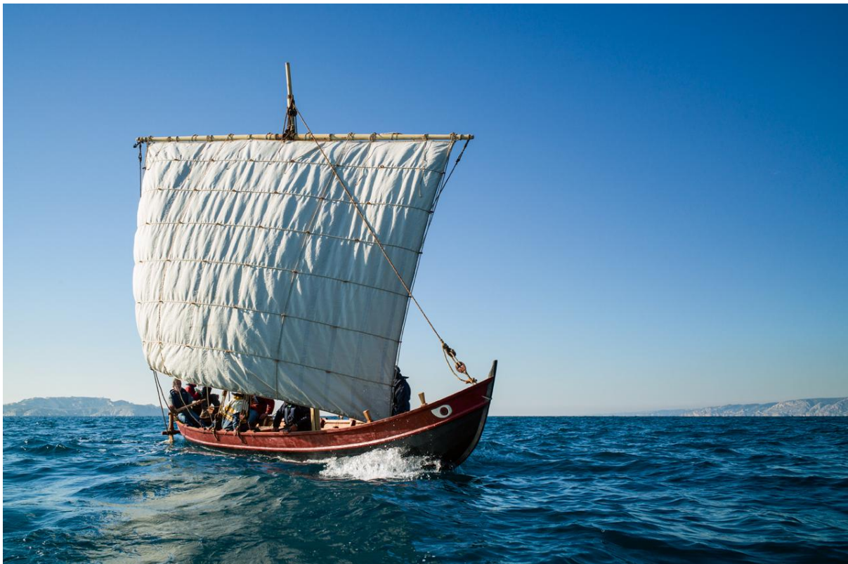
Slika 7 – Gyptis je funkcionalna replika grčkog ribarskog broda iz 6. stoljeća pr. Kr. čiji su ostatci pronađeni u Marseilleu. Koristi se za funkcionalnu replikaciju njegovih plovih svojstva i proučavanje antičkih pomorskih vještina.

razini Colesove eksperimentacije Drugi oblik bihevioralne replikacije su komparativni eksperimenti koji uspoređuju rezultate više funkcionalnih replikacija. Svrha ovih eksperimenata je uspoređivanja relativne učinkovitosti dvije ili više vrsta materijala, objekata ili tehnika i pokušaji razumijevanja razloga primjene jednih ili drugih. Uspoređivanje učinkovitosti brončanih i željeznih sjekira za sječu stabala bio bi primjer komparativnog eksperimenta, na čijem se temelju mogu tražiti odgovori na brojna pitanja vezana uz tehnološki uvjetovane ljudske izbore i društvene kontekste u kojima su se odvijali. Kao treću vrstu bihevioralne replikacije Mathieu navodi fenomenološke studije koje repliciraju ljudsko osjećanje i doživljavanje određenih stvari pod temeljom pretpostavkom da osoba koja vrši eksperiment može replicirati perceptivna ponašanja prošlih ljudi. Ovim apstraktnim i dubioznim studijama nedostaje većina elemenata eksperimentalne arheologije te ih u kontekstu ovog rada ne bih dalje obrađivao. 64