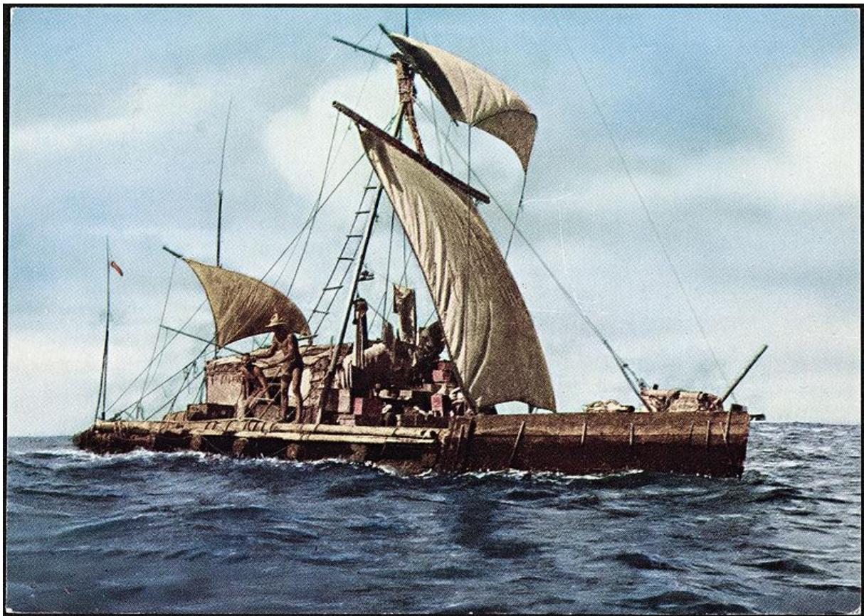
Slika 1 – Akademska vjerodostojna Kon-Tiki ekspedicija pobudila je interes javnosti za eksperimentom kao legitimnom metodom u arheološkom rasuđivanju, no pokazala da pozitivan rezultat eksperimenta ne mora ujedno biti i točan. (Iz Heyerdahl 1950, fotograf nepoznat)

Azije, ovim je eksperimentom slikovito prikazana nužnost za provođenjem eksperimenata u svrhu testiranja teorija kao suprotnosti slijepom prihvatanja raširenih dogmi. Rezultati Kon-Tiki ekspedicije dovode u prvi plan i jedno od važnijih općih načela eksperimentalne arheologije, da pozitivan rezultat eksperimenta ne mora ujedno biti i točan. Od mnogobrojnih sličnih ekspedicija, koje su s vremenom pridonijele popularizaciji i prihvatanju eksperimenta kao metode rasuđivanja u povijesnom i antropološkom kontekstu, spomenuti ću još jedino impresivno putovanje balzatne splavi La Balsa koja je sa četveročlanom posadom u 161 dan preplovila 13 700 kilometar od Ekvadora do Australije. 5