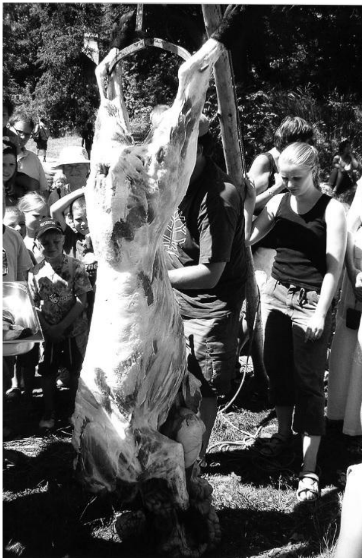
Slika 10 – Brojna publika Eksperimentalnog centra Lejre sudjeluje u demonstraciji deranja veprove kože kremenom oštricom izrađenom pred njihovim očima svega nekoliko minuta ranije.

značajne pedagoške prednosti posjetiteljima uključujući ih u aktivno učenje i otkrivanje novih spoznaja o svim dimenzijama života (pra)povijesnih zajednica u nesvakidašnjem „autentičnom“ okruženju, boreći se protiv ustaljelih predrasuda koje naše pretke često prikazuju kao primitivne neljude bez društvenih ili duhovnih težnji. Davanjem do znanja posjetiteljima da lokalitet ne predstavlja konačnu viziju povijesti, već da je riječ o eksperimentalnim modelima, otvara se prostor za diskusiju o prirodi arheoloških dokaza i povijesti općenito na svim obrazovnim razinama. Arheološki parkovi i muzeji na otvorenom tako postaju