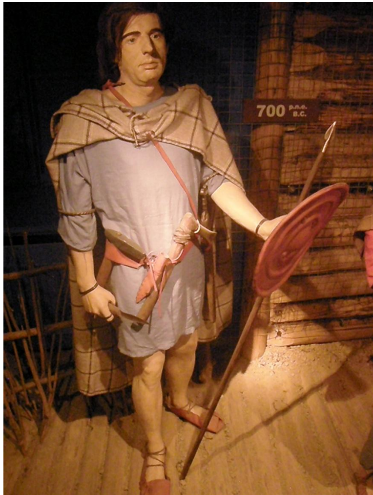
Slika 6 – Vizualne replike kopiraju samo vizualne karakteristike originalnog objekta i najčešće su namijenjene prikazivanju javnosti u muzejima.

aspekti ovih replika trebaju biti autentični te se često izrađuju korištenjem prigodnih materijala i djelomično autentičnih tehnika. Naglasak je stavljen na autentičnost dijelova bitnih za normalno funkcioniranje objekta u kontekstu određenog eksperimenta. Kao primjer ovog tipa replikacije može poslužiti autentično izrađeno kremeno strugalo natakuto u moderni držak. Posljednja skupina replikacije objekata je stvaranje potpune replike korištenjem autentičnih materijala i tehnika. Potpune replike koriste se u testiranju hipoteza o stvaranju i izradi objekata poput artefakata i struktura, njihovih značajka i ostataka. Izrada potpune replike spada u drugi stupanj eksperimentiranja po Johnu Colesu, testiranje procesa i proizvodnih metoda prošlosti. 63