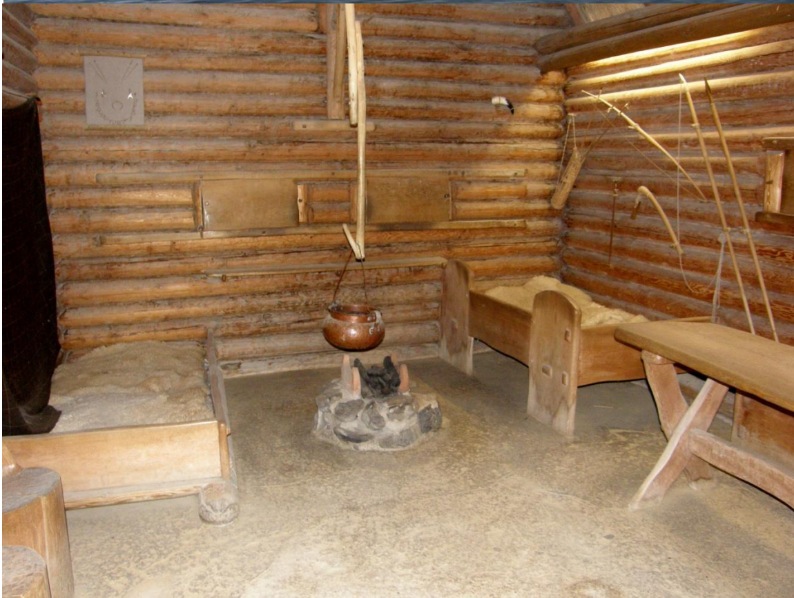
Slika 11 – Arheološki muzeji na otvorenom nude značajne edukacijske i prezentacijske prednosti u odnosu na tradicionalne muzeje no, u slučaju izostanka konstantne eksperimentacije, često prikazuju odviše fiksnu verziju povijesti. (Slikao A. Divić, Pfahlbaumuseum Unteruhldingen muzej, Bodensko jezero)