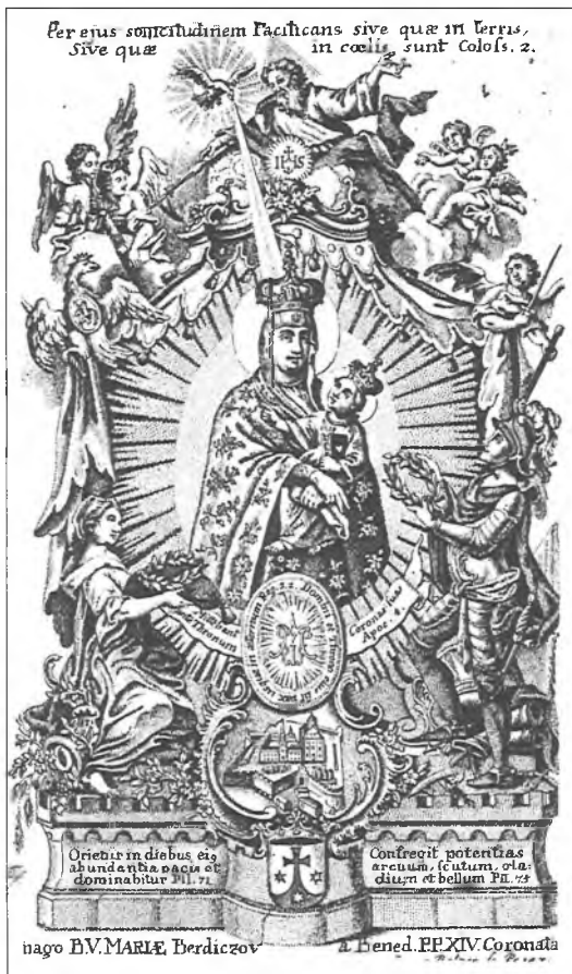
3. Obraz Matki Bożej Berdyczowskiej. Miedzioryt Jana Balcera z Pragi (2 poł. XVIII w.).