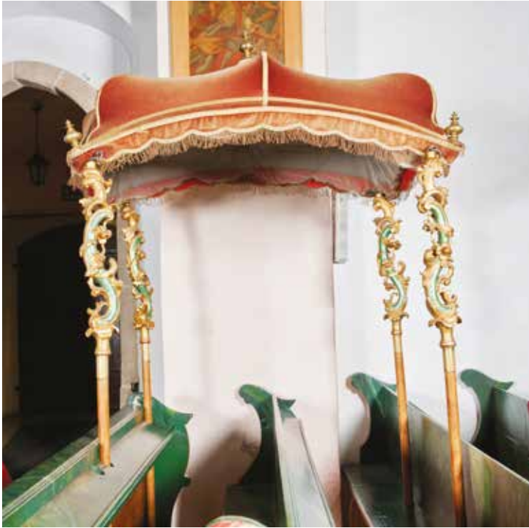
6. Baldachim, 2. poł. XVIII w., kościół par. Wszystkich Świątych w Kacwinie