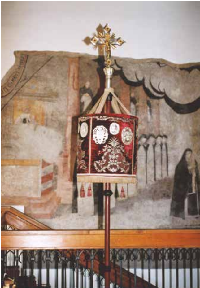
2. Baldachim w typie umbelli, XVII w., Muzeum w Raciborzu, fot. B. Kalfas