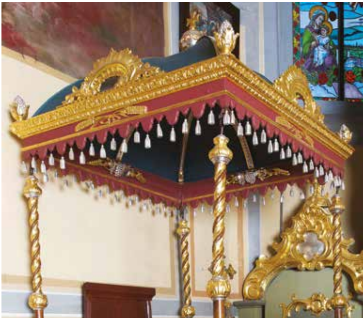
7. Baldachim, 2. poł. XVIII w., kościół par. św. Marcina w Krempachach, fot. R. Nestorow