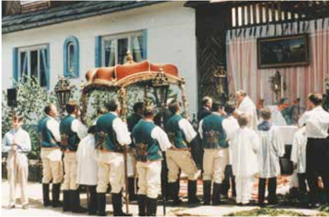
1. Procesja Bożego Ciała w Kacwinie