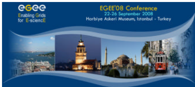
Fig. 1 – Il logo del convegno EGEE'08

La conferenza quest'anno (Fig. 1) si è tenuta in una cornice inusuale, nell'unica città al mondo costruita a cavallo di due continenti, Europa e Asia, a testimoniare il carattere globale dell'iniziativa, oltre all'eccellente lavoro che ricercatori e tecnici turchi stanno facendo all'interno del progetto. I numeri del convegno parlano da soli a testimoniare il successo dell'iniziativa: 545 partecipanti, di ben 48 nazioni, 285 presentazioni in 97 sessioni distinte.