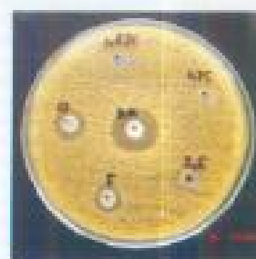
Gambar 2. Area bening di sekitar sumuran menggambarkan zone hambatan pasta gigi kandungan ekstrak teh 2% terhadap A. actinomycetemcomitans . Diameter zone hambatan yang terbesar diperoleh pada konsentrasi 100%, sedangkan yang terkecil pada konsentrasi 5%. Zona hambatan tidak tampak pada konsentrasi 0,875%; 1,75% dan 2,5%.