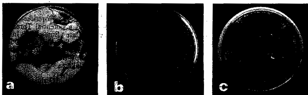
Gambar 4. Potongan akar A. mangium yang diinokulasi dengan (a) G. philippii , (b) T. resei /T13, dan (c) G. philippii dan T. resei /T13 pada hari kesepuluh.

Penelitian ini dibiayai dengan dana DRK No. UGM/446/J.01.P/PL.06.05/97. Untuk itu diucapkan terima kasih.