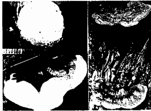
Gambar 2. Tubuh buah G. philippii pada pokok batang A. mangium .

lipatan. Mintakat terluar dari tubuh buah dewasa berwarna coklat kemerahan, yang sedikit demi sedikit beralih ke tepi yang berwarna putih dan sedikit membengkak. Pada waktu masih baru, permukaan bawah (pori) tubuh buah dewasa berwarna putih dan menjadi kelabu setelah kering. Bila tubuh buah dewasa segar dipotong, tampak jaringan berwarna coklat merah kehitaman dan berair. Dalam keadaan kering berwarna coklat muda, lunak dan berbulu. Basidiospora berbentuk lonjong dengan pangkal yang runcing.