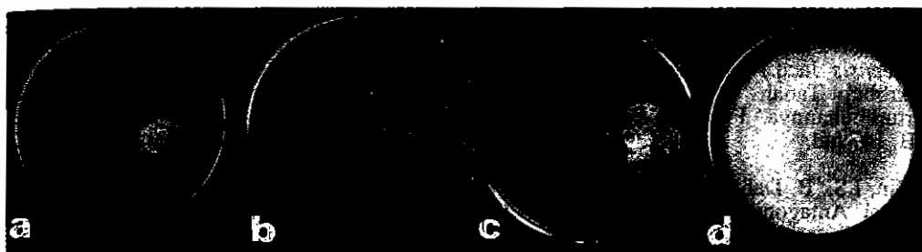
Gambar 3. Pertumbuhan G. philippii dari A. mangium dan Trichoderma sp. terpilih umur 10 hari pada medium PDA (a) G. philippii vs T. resei /T13, (b) G. philippii vs T. koningii /T1, (c) G. philippii vs T. koningii /T16, (d) G. philippii tanpa Trichoderma .

Elad et al. (1983) melaporkan T. harzianum dan T. hamatum mampu menghambat pertumbuhan Sclerotium rolfii dan R. solani melalui mekanisme interaksi hifa dan aktivitas enzim kedua jenis Trichoderma tersebut ( \beta -1,3-glukanase dan kitinase) yang secara sinergis membuat dinding sel jamur inang mengalami lisis. Penelitian terhadap kemampuan antagonistik Trichoderma spp. yang dilakukan oleh Arifin et al. (1987) pada G. philippii yang menyerang perkebunan teh membuktikan hifa Trichoderma spp. mampu menyebabkan lisisnya dinding sel hifa jamur lain.