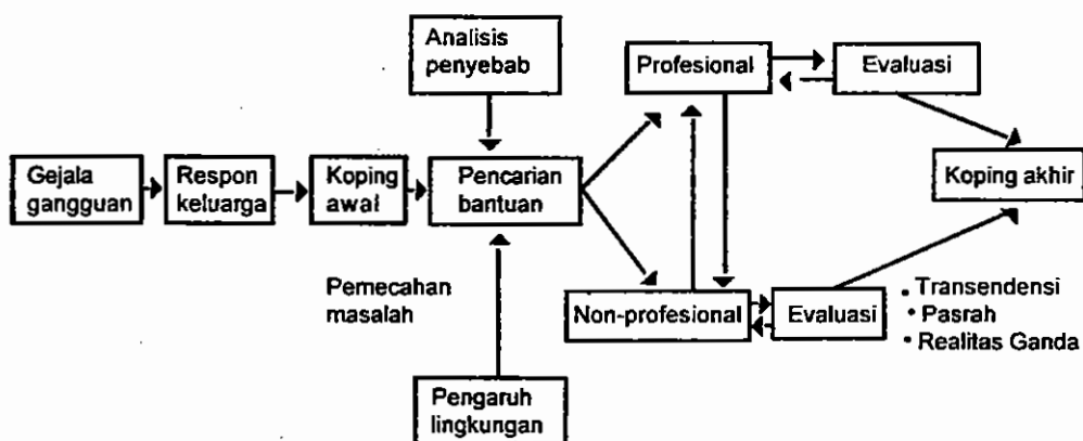
Gambar 2: Pola perilaku mencari bantuan pada keluarga pasien gangguan mental di RSJ Daerah Propinsi DIY

Dari model di atas dapat dilihat bahwa proses pencarian bantuan diawali ketika gejala-gejala yang timbul pada diri pasien dipahami oleh keluarga bahwa