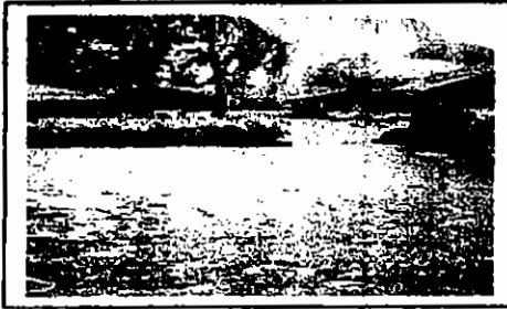
Gambar 1. Daerah resapan air yang telah berubah menjadi area permukiman pemulung.