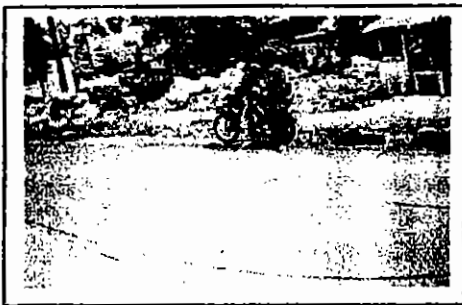
Gambar 3. Kondisi permukiman penduduk/pemulung di pinggir jalan akses masuk ke TPA