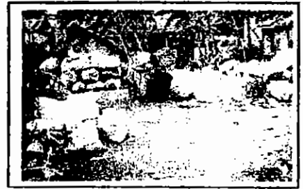
Gambar 2. Pemukiman pemulung yang bercampur dengan permukiman penduduk