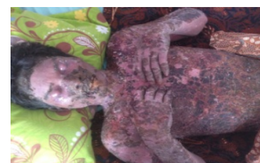
Gambar 2. Sebelum terapi