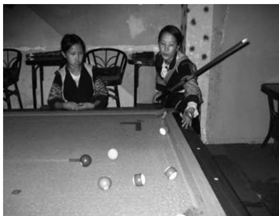
プールバーは彼女たちの「本当」の場ではない？

少数民族トレッキング・ツアーは「自然観察」も含むが、ガイドは「自然」をあくまでも彼らの生活との関連で説明する。トレッキング・ツアーはあくまでも少数民族の文化体験ツアーなのである。ツアー・ガイドの多くは少数民族ではなくベトナムの主要民族であるキン族である。教育が行き届いていない少数民族、特にこの地域の全人口の50%以上を占めるモン族は、小学校も出ていない者も多く（現在20歳以下の世代は大体小学校の教育は受けているが、毎日通っていたとは限らない）国語であるベトナム語も怪しい。町で毎日外国人と接触している少数民族（特にモン族の女性）は英語を流暢に使うが 4 、学校教育で身につけたものでないために、読み書きはできない。モン族の女性の一部はガイドとしてホテルやツアー会社に雇われることもあるが、正式のガイドではなく、日雇いの使い捨てガイドとしてである。したがって、トレッキングの「裏舞台」の解説はあくまでも、キン族から見た少数民族についてであり、少数民族の女性がガイドとして日雇いで雇われた場合でも、キン族ガイドの解説モデルを踏襲するように指示される。