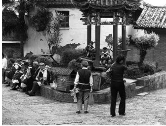
元住民のコミュニティ

ら来た納西族もいる) 業者に貸し、一家は故城地区から離れたゲート付きマンション等に住んでいる。しかし、自分たちのコミュニティが懐かしくて昼間は毎日のように故城地区に通っている。従って、昼間はあちこちに集まりおしゃべりをする納西族の姿を見かける。