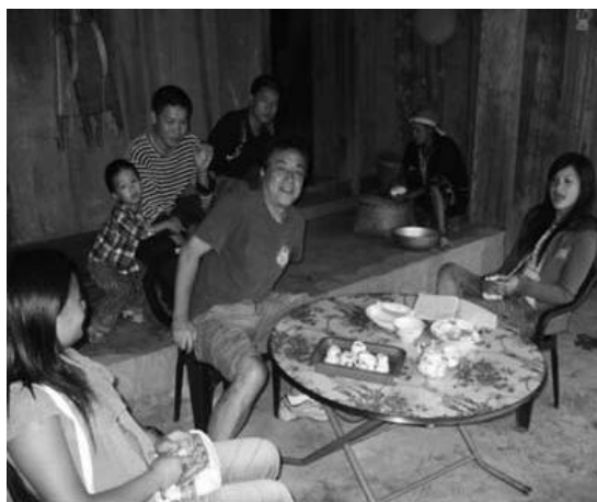
民宿（ホームステイ）を営むザオ族

モン族とは違い、教育熱心で裕福であるザイ族やザオ族の一部は、民泊（ホームステイ）という収益性のある事業を立ち上げ、自らの生活を観光の文脈と混在させながらも、観光産業のなかに何とか包摂されることに成功している。だがしかし、多くの少数民族は、特にモン族は、自ら観光の対象になりながら、観光産業からはほとんど排除されている。