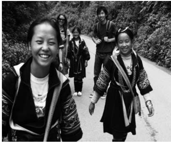
モン族がガイドするトレッキング・ツアー

(Ta Van) の集落には、1990年代から教育程度の高いザイ族が経営する民宿が40軒ほど開業している。ここにも近年、民族風のバーやスパができ、「裏舞台」は次第に「表舞台」と区別がつかないものになりつつある。