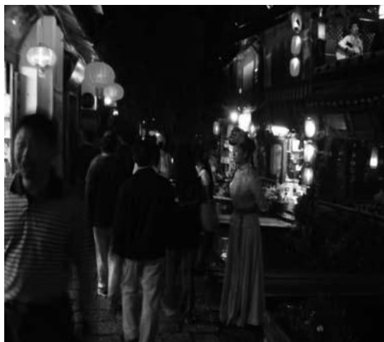
夜間の照明も演出されている

国内観光客も増えだした麗江市を訪れた1990年の観光客数は延べで9.6万人であり、その内外国人が6千人である（車、2008）。1994年の観光客は22万人（内外国人1.5万人）と国内観光客を中心に観光客は増え出す。しかし、1996年にはM7の直下型地震が麗江市一帯を襲い、納西民族の伝統的な街並みの大半は崩壊し、伝統家屋を保存した観光地としては再起不能とまで言われた。だが、この地震で被害を受けた納西族の伝統家屋の話題が世界中のメディアに乗ると事態は一変した。貴重な伝統住居が残されていることが世界に知れ渡り、1997年に麗江故城はユネスコ世界遺産に登録されたのである。観光客は急増し、1998年には一気に201万人へと膨張する。201万人の内外国人客は4.6万人でしかないことから、いかに国内客が急増したかが分かる。国内客中心に急増した観光客のほとんどは限られた地域である故城地区へと向かう。2008年の入込み客数は625万人（内外国人47万人）である。現在では、迷路のように入り組んだ故城の通りの奥まで、観光客でごった返す光景が日常となっている。