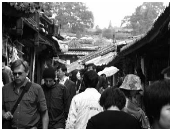
観光客でごった返す麗江

前節では、文化の観光化による「裏舞台」の変節、そのことが引き起こす「文化」の分裂について述べた。観光の文化や経済に上手く乗る人々と上手く乗れない人々の分裂、「裏舞台」の中の「観光」と「生活」が混在し、さらにこの二つの分裂が露わになりつつあるのがベトナムの民族観光の特徴であった。これから取り上げる中国の民俗観光は、一民族ごと一気に観光の文脈に乗せてゆく。しかし、観光地において「観光」と「生活」の混在と分裂を回避し、自らの生活文化をトータルに「観光」の文脈に入れ込むことが、少数民族の自立につながるとは限らない。少数民族が観光化されることにより、「生活」の文脈が一気に「観光」の文脈へ、名実共に置き換えられていった例として中国雲南省麗江の例を見てゆこう。