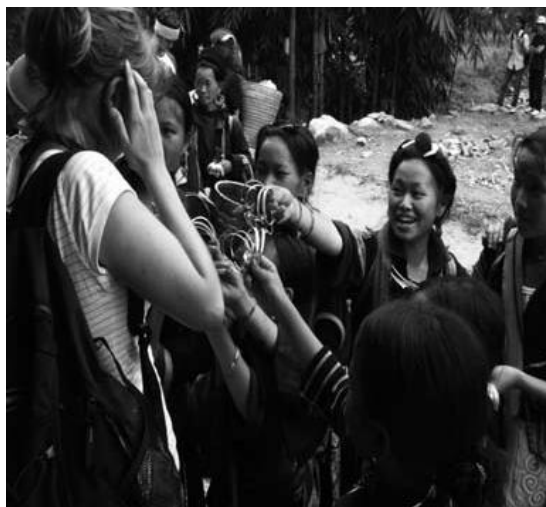
土産物を押し売りするモン族の女性

この地が少数民族観光地として脚光を浴びるようになったのは、極めて最近のことである。サパの町自体は、植民地支配していたフランス人が1920年代頃からフランス人用の避暑地として観光開発した経緯はあるが 3 、後述するように1954年のディエン・ビエン・フーの戦いで空爆を受けて以来、戦場化したこの地域は、1990年代に至るまでは観光地としては廃棄された町であった。しかし、観光と関係がなかった少数民族にとっては、サパの町は宗主国からフランス人が来る前から物々交換的交易中心であり、戦場化したときでさえ、少数民族の交易は行われていたと言われている。今でも町の中心にある市場には農産物等を持って彼らが毎日やって来る（1995年に市場が鉄筋の建物に改築されるまでは市は土曜と日曜が主であったという）。だがしかし、現在彼ら、特に若い女性たちがサパの町に毎日通う主な目的は農作物や家畜等の売買ではない。観光客に土産物を観光客に売り歩く者も多い。一部はホテル（日雇いのガイドとしてであるが）等サービス産業に従事している（日雇いであってもホテル等の雇われる労働者になれる者はかなり幸運な方であるが）。現在では市場も観光のアトラクションとなりつつあり、観光客の行き交う場となっている（一部の少数民族は観光客が市場に出入りすることを