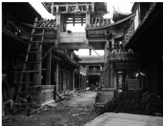
「復元」?で創られる新しい「故城」

観光化の圧倒的な力によって、納西族の「生活」の文脈は引きはがされ、「観光」の文脈に置き換えられている。故城内には観光客のための劇場があり、ショーと化した納西族の踊りがプロの役者によって演じられ披露されている 7 。故城に家を持つ納西族の住人は観光化の恩恵に服してはいる。高い賃貸料が彼らに支払われている。しかしながら、観光客に示す文化は彼らの「生活」の残り香のある建物だけであり、「生活」そのものではない。彼らが故城を去る理由は、賃貸料収入だけの問題ではないのかも知れない。観光客が押し寄せる故城で静かに生活を送ることはもう不可能であるともいえる。いずれにせよ、彼らの「生活」は彼らの住居から「排除」されている。