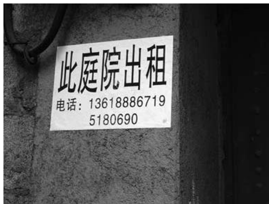
奥の家までみんな貸し出していて人気がない

聞き取りを行った杭州から来た服屋は、裏手なので年10万元の賃貸料、この町に来て一年で店をたたむ準備（閉店セール中）をしていると言う。中心にある広場近くのやはり服飾を扱っている店のオーナーは福建省から来たという。年間20万元の賃貸料を払っている。このオーナーは、一年前までは雲南省南部の町、西双版纳で店を開いていた。流行っている観光地で稼ぎ、ブームが去れば他の観光地へと移動するという商法をしているという。新しくできたばかりのバーの若いオーナーにも聞いてみた。彼は四川省からやって来たばかりだ。年間10万元の賃貸料。客はまだあまり入らないが、観光地の生活は刺激があり楽しいという。妻が納西族だというアウトドアショップのオーナーは、年間20万元の賃貸料を払っている。賃貸料高騰のため、筆者が前年に訪れたときに比べ間口が半分になっていた。