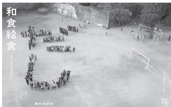
図2 農水省発行の冊子「和食給食」 (表裏の表紙を広げた写真)

平成27年度版、農水省のホームページより、2017年6月取得 白いことができないかと考えました。』 9 と述べ、全国の和食料理人が学校を訪問し、調理講習会を開いた様子を納め、こうした取り組みで和食は子どもたちの身近な存在になると述べる。