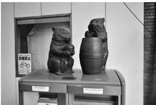
図 2-c 池田栄町商店街に設置されている郵便ポスト上のウォンバット像 (2016 年 11 月 30 日)