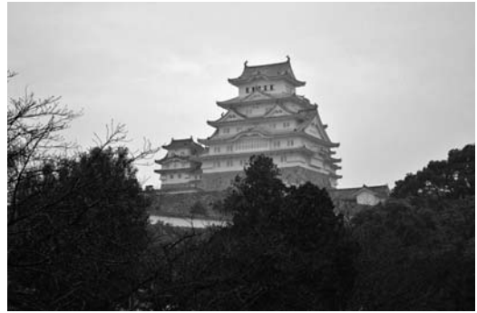
図1-a 動物園内から見た姫路城 (2016年11月27日)

なお、姫路市立動物園のように城内に併設されている動物園としては、小田原城内の城址公園にある動物園や和歌山城内の和歌山公園動物園を挙げることができる。しかし、小田原城の場合には閉園同然となっている。「小田原動物園」は小田原市の「こども文化博覧会」の開催に合わせて '50年に開園したが、小田原城跡の国史跡指定（'59年）に際して国から「史跡にふさわしくない」という指摘を受けたことや、獣舎の老朽化に伴う維持管理費の問題などもあり、'05年度から動物園施設の撤去作業が開始された。しかし、「縄張り意識」が強いニホンザルについては引き取り先がなく、現在も飼育さ