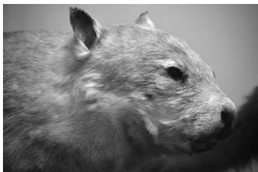
公開された（朝日新聞，1985 b；神戸新聞，1985 c）。ところが，ウォンバットが「穴居性の夜行動物」であるために，昼間は姿を見せないという事態が生じた（神戸新聞，1985 d；読売新聞，1985 b）。木製トンネルなどの対策がとられたがうまくいかず（神戸新聞，1985 e），コンクリート管と土砂を併用して設置したところ，ウォンバットのお気に入りの場所となった（神戸新聞，1985 f）。7月18日には一般公開され，入園者もウォンバットの姿を見ることができるようになり，子どもたちも喜んだ（神戸新聞，1985 g）。

ところで、動物交流によって動物園にウォンバットが来たことが入園者数にどのような変化をもたらしただろうか(表 1-b 参照)。ウォンバットが来た '85 年の入園者数は前年とほとんど変わらなかったが(9,104 人減)、'86 年には入園者の増加が見られた(31,555 人増)。しかし、'87 年では通常の入園者数に戻ったといえよう(18,200 人減)。ウォンバットの来園が上述したようにメディアで頻繁に取り上げられたことや、飼育施設の設置のためにかなりの費用がかかったことなどを勘案すると、この入園者数の動向は意外な結果と判断できる。ただし、動物園職員によると(著者による直接ヒアリング:2015 年 11 月 7 日)、「動物園は基本的に屋外施設であるため、入場者数が多少その年の気候や気温に影響されることもある」とのことである。しかしながら、ウォンバットの来園が姫路市立動物園に恒常的な活気をもたらしたとは判断できない。これは、ウォンバットがそもそも「穴居性の夜行動物」であるため、来園反復行動の喚起につながらなかったといえよう。