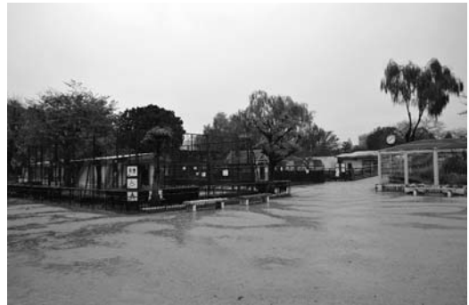
図1-b 姫路市立動物園内の風景 (2016年11月27日)