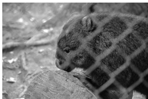
図 2-a 五月山動物園で飼育中のウォンバット (2016 年 11 月 30 日)

以上に述べたように, 姫路市立動物園にウォンバットは鳴り物入りで登場するが, 動物園の中心的存在にはならなかった。さらに, このウォンバットの継続的飼育は失敗に終わった。