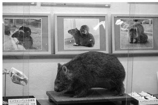
図 2-b 五月山動物園内で展示されているウォンバットの剥製 (2016 年 11 月 30 日)