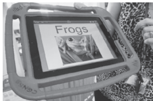
(写真4) 教材用のタブレット