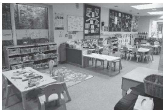
（写真6）2歳児保育室内

職にある。エフラは次項で述べる Being Two プロジェクトにも参加しており、その成果の一部が展示してあった（写真7）。