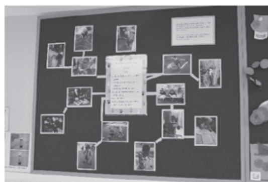
（写真7）「2歳児とは」プロジェクトの展示

B2プロジェクトの目的は集団保育を受ける2歳児とその家族の経験の質を高めることであり、特にもっとも剥奪された状況にある子どもの発達にその成果をもたらすことであった。プロジェクトでは次の5つの柱が立てられ省察的実践が行われた。