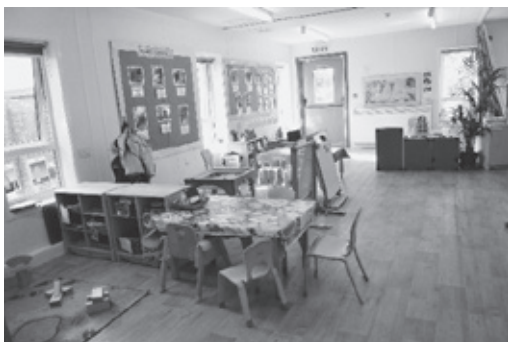
(写真3) 保育室の様子その2