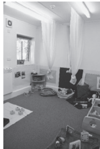
(写真2) 保育室の様子その1