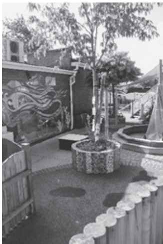
(写真1) 0～3歳児用の園庭

3・4歳児はナーサリースクールで所定の無償教育を受けることができる。年間38週（学期間）、1回あたり3時間のセッションを5回分については無償であるが、それ以上の利用については始業前の朝食クラブ、終業後の放課後クラブ、長期休暇中の休日保育が設定されており、別途保育料が必要である。ランチについても別途費用が徴収され、