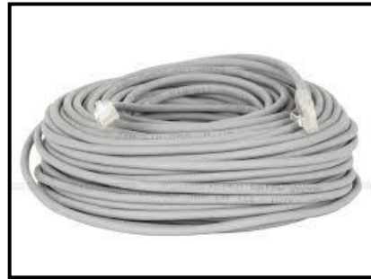
Gambar 2. Kabel UTP Cat 5e