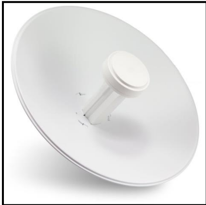
Gambar 1. Powerbeam M2