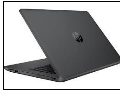
Gambar 4. Laptop