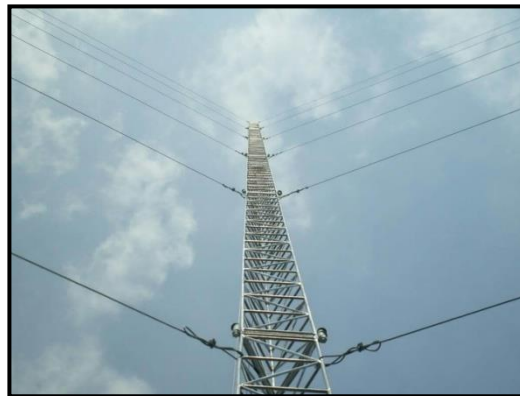
Gambar 5. Tower Triangle

Langkah pertama adalah dengan menghitung ketinggian radio accespoint dan station yang diperlukan agar jaringan pont to point bisa terbentuk sempurna (fresnel zone terpenuhi sempurna). Penghitungan tersebut menggunakan aplikasi airlink yang dijalankan secara online (terhubung ke internet). Selanjutnya dilakukan implementasi pemasangan radio di kedua titik / kedua lokasi tersebut dan menyimpan data hasil jaringan point to point yang berupa kuat sinyal, nilai CCQ, dan troughput menggunakan aplikasi airOS. Gambar 6 menunjukkan perhitungan tinggi minimal radio pemancar dan penerima dari kedua titik.