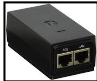
Gambar 3. POE (Power of Ethernet)