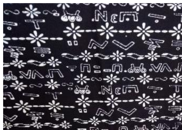
Gambar 2. Kota Sungaipenuh dijadikan sebagai motif batik Incung