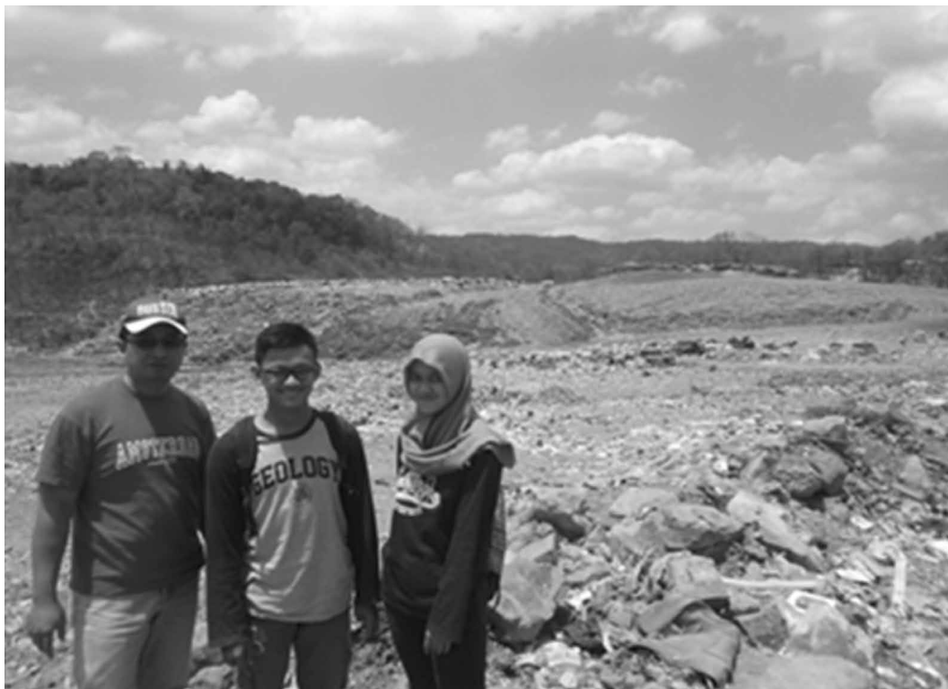
Gambar 4 Kunjungan Lapangan ke TPA Piyungan

Banyak faktor yang memengaruhi produksi dan komposisi lindi di TPA Piyungan. Salah satunya adalah pengaruh curah hujan yang menyebabkan produktivitas lindi semakin banyak. Selain itu, topografi lokasi TPA juga memengaruhi pola limpasan dan keseimbangan tubuh air yang akan berdampak terhadap kualitas air tanah di sekitarnya. Upaya pencarian lokasi baru untuk TPA perlu dilakukan mengingat lokasi ini sudah hampir penuh oleh sampah. Dari kunjungan ke TPA Piyungan diperoleh sebuah pelajaran bahwa kondisi geologi akan sangat berperan dalam pertimbangan pemilihan TPA. Selain itu, ada hal-hal lain yang juga perlu dipertimbangkan ketika menentukan TPA baru di waktu yang akan datang. Hal-hal itu adalah (a) memperhatikan kondisi muka air tanah, (b) bagian dasar TPA diberi liner atau alas yang terbuat dari campuran tanah liat dan dipadatkan, dan (c) sampah yang menumpuk ditutup dengan lapisan lain untuk mencegah menyebarnya gas metan akibat proses pembusukan sampah. Metode ini bermanfaat untuk melindungi TPA dari pencemaran lingkungan. Kunjungan lapangan ini dapat dilihat pada gambar 4 dan 5.