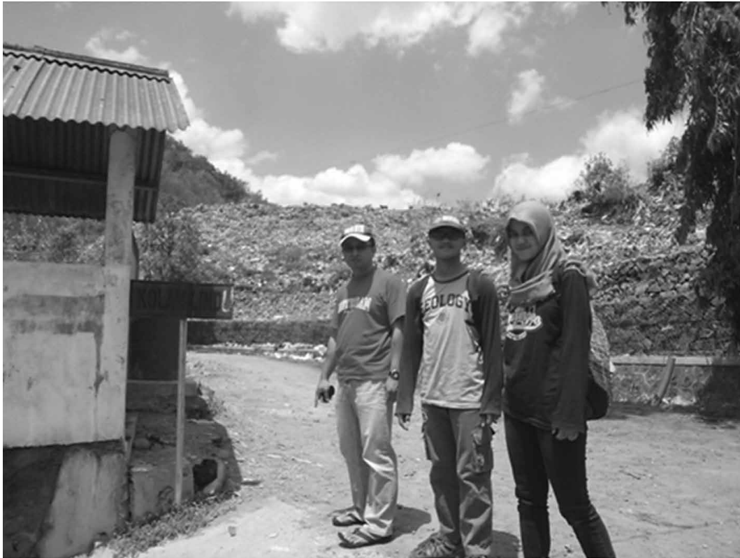
Gambar 5 Kunjungan Lapangan ke TPA Piyungan

Lokasi kedua yang dikunjungi adalah tempat penambangan minyak bumi tradisional atau penambangan rakyat di Kawengan, Bojonegoro, Jawa Timur. Desa Kawengan, Kecamatan Kedewan, Kabupaten Bojonegoro identik dengan tambang minyak tradisional. Berdasarkan data desa tahun 2015 diketahui bahwa lebih dari 50% warga Kawengan beraktivitas sebagai penambang minyak secara tradisional. Lapangan minyak Kawengan terletak kurang lebih 22 km di sebelah timur laut Kota Cepu yang membentang dari arah barat laut ke tenggara kurang lebih sepanjang 15 km dengan lebar bagian barat 1 km dan lebar bagian timur 1,5 km. Kondisi geologi regional lapangan minyak Kawengan termasuk dalam Antiklinorium Rembang yang terdiri atas antiklinal-antiklinal yang membentang dari barat ke timur. Ketinggian lapangan minyak Kawengan pun bervariasi, yaitu antara 140 sampai 200 meter di atas permukaan laut. Produksi sumur minyak di daerah ini sebagian disetor ke Pertamina Cepu, tetapi sebagian produksi minyak mentah lainnya disuling secara tradisional oleh para penambang untuk dijadikan bahan bakar minyak. Adapun kondisi lingkungan di lapangan sumur minyak ini sudah tidak terjaga karena para penambang membuang sisa buangan air yang masih bercampur minyak ke sungai setempat sehingga menimbulkan pencemaran. Kunjungan lapangan ini dapat dilihat pada gambar 6 dan 7.