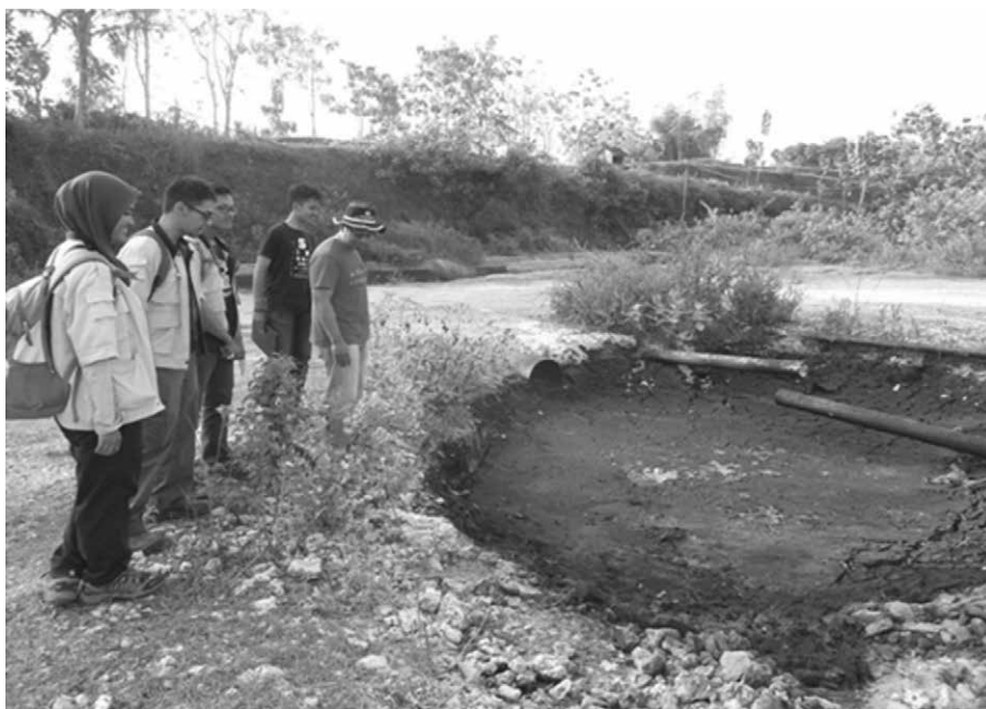
Gambar 7 Kunjungan Lapangan ke Lapangan Minyak Tradisional di Bojonegoro

Lokasi berikutnya yang dikunjungi adalah daerah Tawangmangu, tepatnya di Dusun Guyon, Desa Tengkluk, Kabupaten Karanganyar, Jawa Tengah. Di lokasi ini telah terjadi tanah longsor yang menyebabkan 27 rumah rusak berat dan rusak ringan sehingga sebanyak 33 keluarga harus diungsikan. Peristiwa tanah longsor tersebut menyebabkan Dusun Guyon berada pada tingkat kerentanan yang tinggi untuk mengalami longsor ulang. Hal ini disebabkan longsor adalah tipe rayapan yang berhenti sementara sehingga akan mudah bergerak lagi