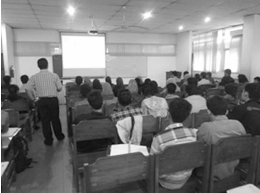
Gambar 2 Kegiatan Pembelajaran di dalam Kelas