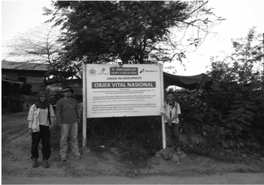
Gambar 6 Kunjungan Lapangan ke Lapangan Minyak Tradisional di Bojonegoro