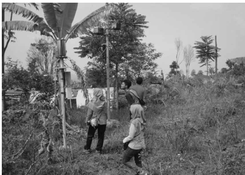
Gambar 9 Kunjungan Lapangan ke Tawangmangu, Karanganyar