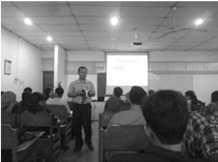
Gambar 3 Kegiatan Pembelajaran di dalam Kelas

Hasil laporan kunjungan lapangan ke setiap lokasi akan dijelaskan sebagai berikut. Lokasi pertama yang dikunjungi dalam kegiatan ini adalah Pembuangan Sampah Akhir (TPA) di Piyungan, Bantul, Yogyakarta. TPA (Tempat Pembuangan Akhir) Piyungan berada di Dusun E, Desa Sitimulyo, Kecamatan Piyungan, Kabupaten Bantul, Yogyakarta. Kunjungan ini bertujuan untuk melihat lokasi TPA dan mengetahui tingkat terpenuhinya syarat-syarat