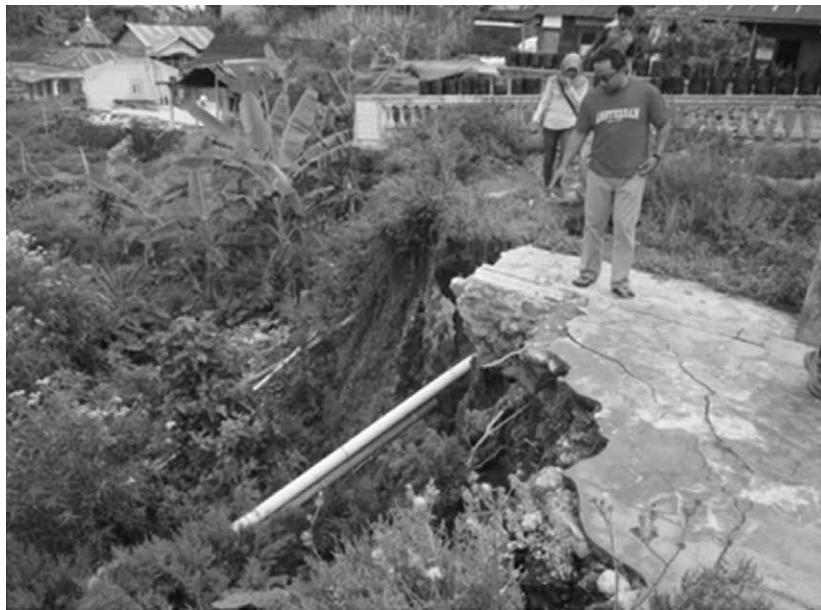
Gambar 8 Kunjungan Lapangan ke Tawangmangu, Karanganyar

jika ada gaya yang memicunya. Longsor di Dusun Guyon harus dipantau pergerakannya mengingat tanah longsor yang terjadi pada tahun 2007 telah menyebabkan penurunan tanah sebesar 20 cm dan pada Agustus 2009 telah bergerak turun hingga mencapai 260 cm (Naryanto, H.S., 2011). Pengelolaan daerah yang rawan longsor dapat dilakukan dengan teknik sederhana, yaitu (a) mengatur saluran pembuangan air sehingga air tidak mengalir masuk ke daerah yang pernah atau rawan longsor, (b) mengolah lahan tegalan untuk bertanam sayur dengan penyiraman air secukupnya, dan (c) melakukan penanaman pohon yang akar-akarnya dapat berfungsi sebagai jangkar di dalam tanah dan menurunkan kadar air dari dalam tanah. Kunjungan lapangan ini dapat dilihat pada gambar 8 dan 9.