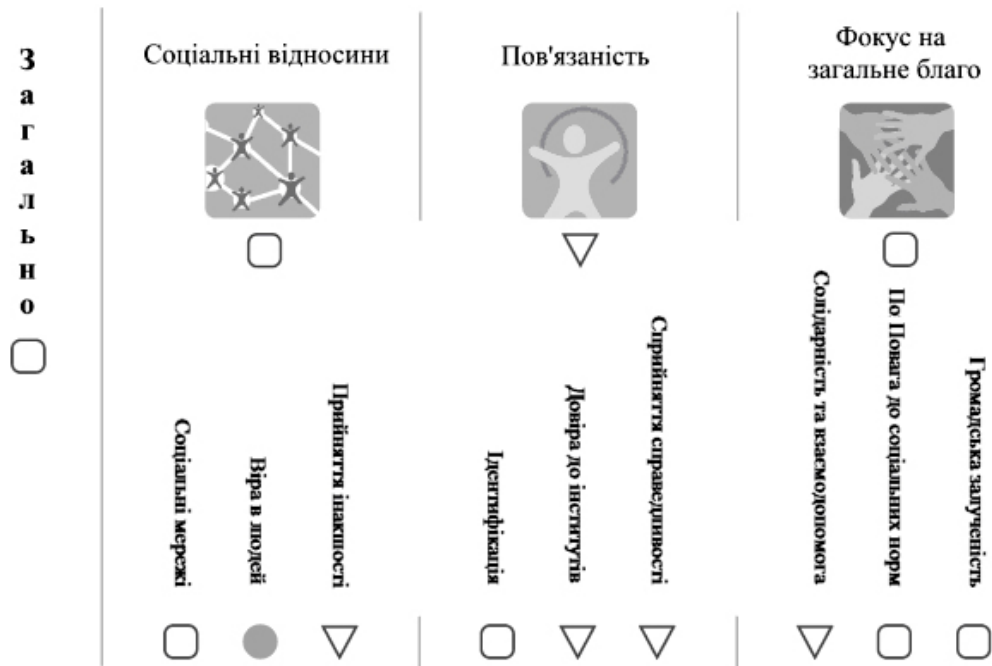
Рис. 2. Соціальна згуртованість (Україна)

ти, що Україна за результатами 2012 р. перебувала на різних щаблинах за різними вимірами соціальної згуртованості (рис. 2).