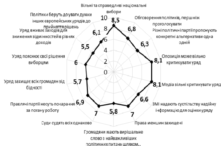
Рис. 3. І профіль функціонування основних демократичних цінностей (середні значення серед країн, які віднесено до даного профілю)

У результаті аналізу було виокремлено країни, які найбільш повно забезпечують такі елементи, як проведення незалежних виборів, захист уразливих груп (захист прав меншин), чесна та незалежна судова система, відповідальність уряду – за свою діяльність у разі негативних наслідків та пояснення своєї політики громадянам (рис. 3).