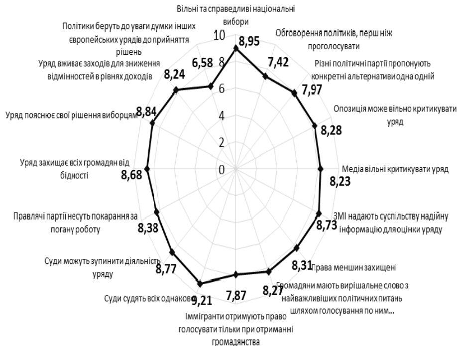
Рис. 1. Основні демократичні принципи