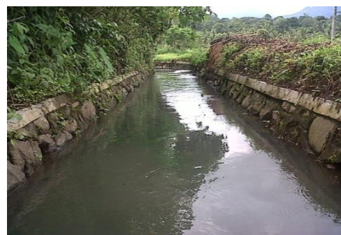
Gambar 4. Saluran Sekunder

Pada pasal 1 poin 14 PP No.20 Tahun 2006 tentang Irigasi. Saluran Irigasi sekunder adalah bagian dari jaringan Irigasi yang terdiri dari saluran sekunder, saluran pembuangannya, bangunan bagi, bangunan bagi-sadap, bangunan sadap, dan bangunan pelengkap. Salura sekunder adalah tanggung jawab Pemerintah Provinsi/Kabupaten dengan proses pengelolaannya dilakukan oleh Petani Pengguna Air (Anonim 2 , 1986).