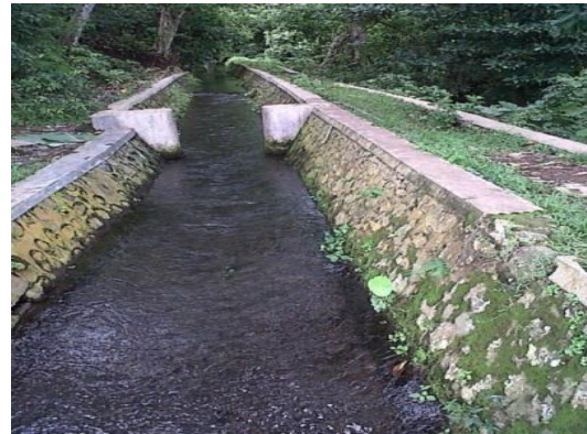
Gambar 3. Saluran Primer

permanen dengan pertimbangan. Pertama , tidak memungkinkan untuk membuat saluran