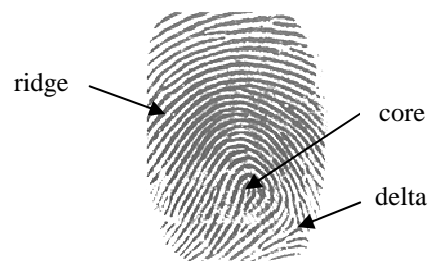
Gambar 1 Fitur-fitur sidik jari

Dari sejumlah penelitian yang sudah dilakukan seperti pada [5][6][7] dilaporkan bahwa keberadaan dan posisi core dan delta sangat handal untuk menentukan klas suatu sidik jari. Banyak algoritma dan penelitian telah dikembangkan untuk menentukan keberadaan dan posisi core dan delta dalam suatu sidik jari.