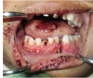
Gambar 2. Kondisi Intra Oral Pasien. Tampak periode gigi bercampur, tampak celah diantara gigi 32-73, tampak luka robek pada gingiva antara gigi 32-73

Pada pemeriksaan intra oral ditemukan luka robek pada gingiva diantara gigi 32-73 ukuran 0,5 x 0,5 x 1 cm tepi tidak rata dengan dasar tulang, ditemukan edem dasar mulut, palatum dan lidah.