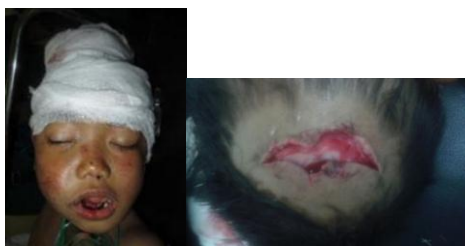
Gambar 1. Kondisi klinis maxilofasial pasien. Tampak wajah asimetris, deviasi mandibular, Tampak luka robek pada parietal kanan ukuran 4 x1 cm dengan dasar periosteum

Status lokal dengan ekstra oral wajah asimetris, tampak luka robek pada parietal kanan dengan ukuran 4 x1 cm dengan dasar periosteum, edema dan hematoma pada pipi kanan, terdapat banyak luka abrasi pada wajah.