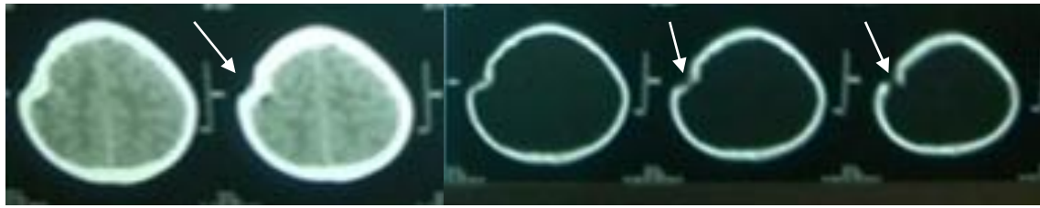
Gambar 4. Foto CT Scan Kepala. Tampak diskontinuitas tulang pada parietal kanan