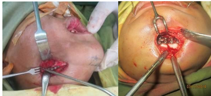
Gambar 6. Prosedure Open Reduction Intermaxillary Fixation . Tampak reposisi fraktur dan pemasangan miniplate di daerah fraktur angulus mandibula kanan dan fraktur parasymphisis mandibula kiri

Bagian Bedah Saraf mendiagnosa cedera kepala sedang dengan fraktur terbuka lebih dari satu tabula pada parietal kanan, lalu dilakukan prinsip penatalaksanaan cedera kepala sedang sesuai ATLS ( Advanced trauma Life Support ), dimulai dengan primary survey , resusitasi dan penatalaksanaan, secondary survey dan stabilisasi, kemudian craniectomy debridement .