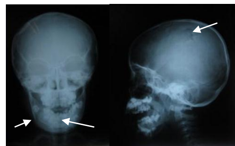
Gambar 3. Foto polos kepala. Tampak garis fraktur pada angulus mandibula kanan, tampak garis fraktur pada parasymphisis mandibula kiri, tampak Double Countour pada parietal kanan

Setelah dilakukan pemeriksaan klinis kemudian dilakukan pemeriksaan penunjang berupa pemeriksaan laboratorium darah, foto toraks, foto polos kepala, cervical, CT scan Kepala dan panoramik. Foto polos kepala menunjukkan adanya garis fraktur pada sepanjang 4 cm, keadaan normal pada bibir, vestibulum, fraktur pada parasymphisis mandibula kiri dan tampak Double Contour pada parietal. Foto CT Scan Kepala tampak diskontinuitas tulang pada parietal kanan. angulus mandibular kanan, tampak garis kanandan hematoma pada mukosa bukal Foto panoramik tampak garis fraktur pada angulus mandibula kanan, tampak garis fraktur pada parasymphisis mandibula kiri. (Lihat Gambar 3)