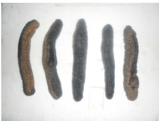
Gambar 2 Teripang Getah Kondisi Basah