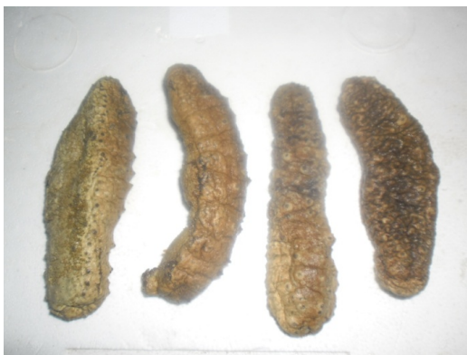
Gambar 1 Teripang Karang Kondisi Basah