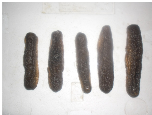
Gambar 3 Teripang Dada Merah Kondisi Basah