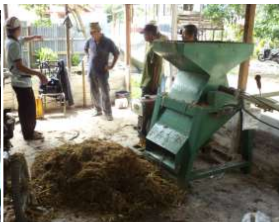
Hasil pencacahan jerami