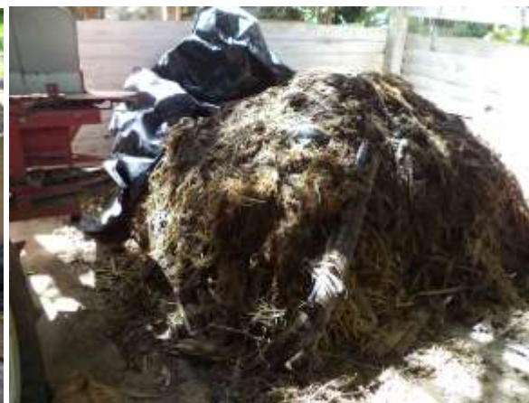
Pupuk organik siap untuk digunakan