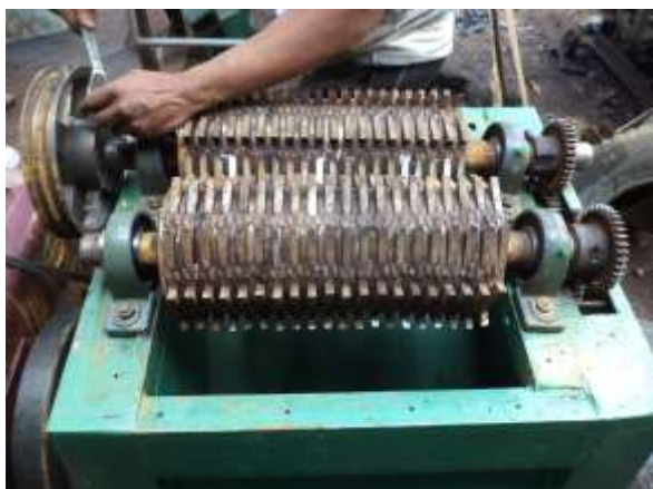
Pisau pencacah tipe piringan