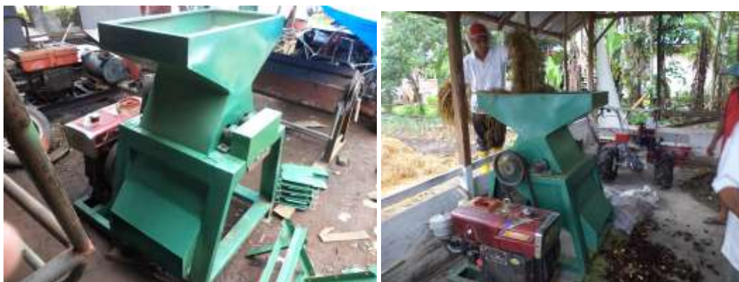
Gambar 2. Pengujian kinerja mesin pencacah di lapangan