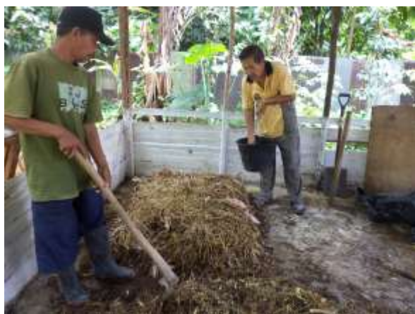
Pemberian mikro organisme lokal perombak