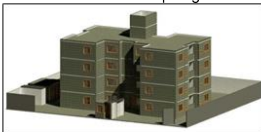
Figura 1 – Projeto Padrão Caixa Econômica Tipologia R4-2B-48C

A figura 1 a seguir ilustra o projeto padrão em estudo R4-2B-48C: