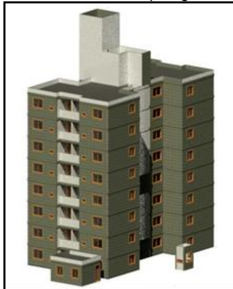
Figura 2 – Projeto Padrão Caixa Econômica Tipologia R8-2N-48C

A figura 2 a seguir ilustra o projeto padrão em estudo R8-2N-48C: