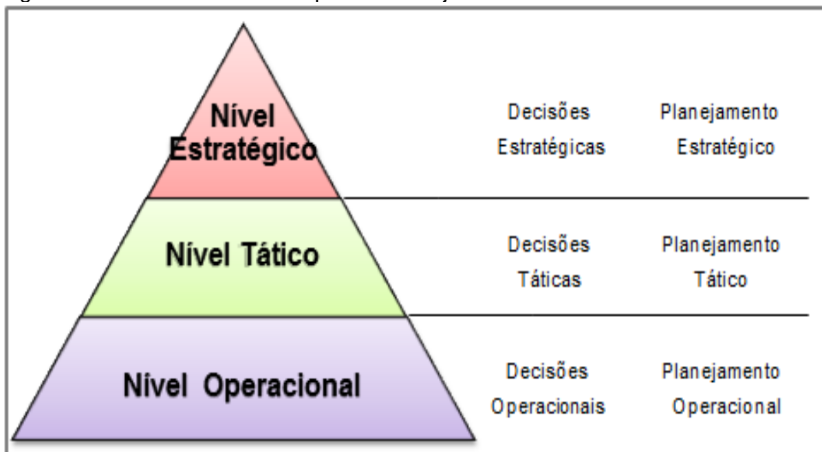
Figura 1: Níveis de Decisão e Tipos de Planejamento