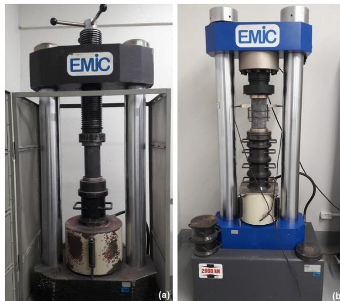
Figura 4: Equipamentos utilizados para os ensaios.

Os equipamentos utilizados para os ensaios de testes de compressão axial foi à prensa hidráulica da marca EMIC, modelo PC200I (Figura 4a). Já para os para os ensaios do módulo de elasticidade, foi utilizada à prensa hidráulica da marca EMIC modelo PC200CS, com capacidade máxima de 200 toneladas (Figura 4b). As duas prensas são acopladas a um computador com software TESC - Test Script, para obtenção dos resultados.