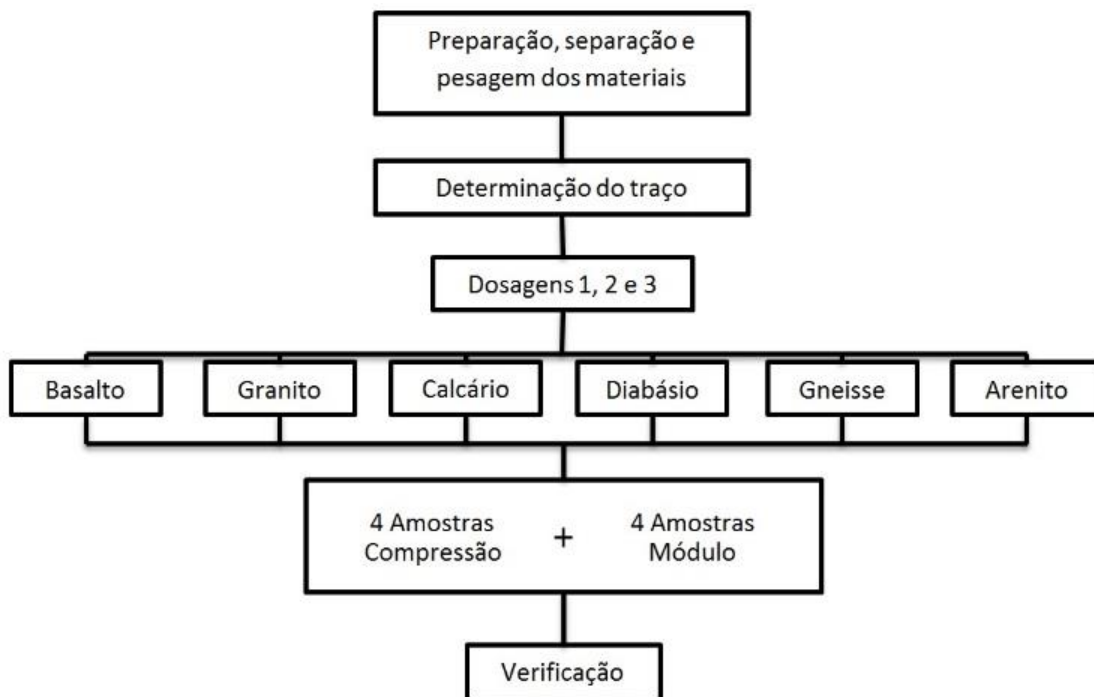
Figura 1: Fluxograma das atividades desenvolvidas

No estudo foram realizadas três misturas para cada material, sendo feito dois testes: Resistência à Compressão Axial e Módulo de Elasticidade. Por fim os valores encontrados foram aplicados na equação proposta pela NBR 6118:2014 a fim de se chegar aos coeficientes estimados pela mesma. Os concretos utilizados para a confecção dos corpos de prova (CP) foram produzidos no Laboratório de Materiais de Construção Civil (LMCC), localizado no Iparque, da Universidade do Extremo Sul Catarinense (UNESC). A Figura 1 apresenta o fluxograma das ações desenvolvidas nessa pesquisa.