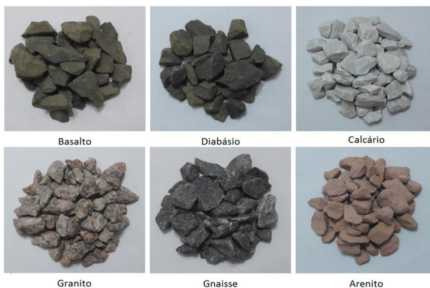
Figura 2: Agregado Graúdo

A Figura 2 apresenta o aspecto visual de cada tipologia de agregado graúdo utilizado na composição dos diferentes traços.